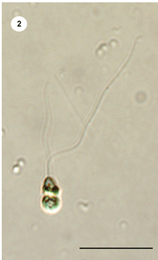
Figura 2. Aspecto general de Spermatozopsis similis al microscopio óptico. Barra escala= 10 \mu\text{m} .