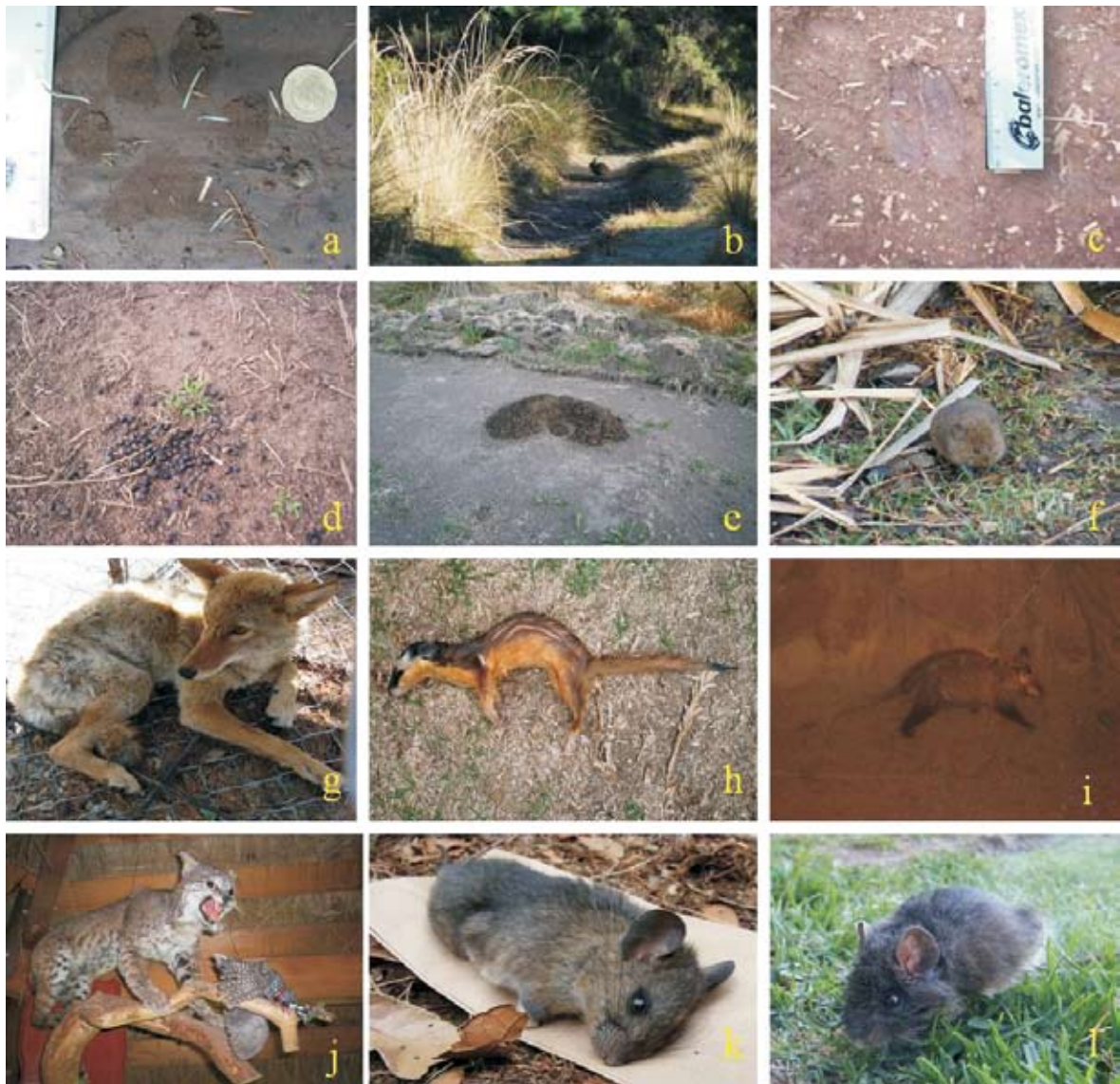
Figura 2. Evidencia fotográfica de la presencia de algunos mamíferos en el Parque Ecoturístico Piedra Canteada y alrededores, San Felipe Hidalgo, municipio de Nanacamilpa de Mariano Arista, Tlaxcala, México. a, huella de Puma concolor ; b, Romerolagus diazi ; c, Huella; d, excrementos de Odocoileus virginianus ; e, Madrigueras de Thomomys umbrinus y Cratogeomys merriami ; f, Microtus mexicanus ; g, Canis latrans (individuo capturado por los propietarios del PEPC); h, Mustela frenata ; i, Didelphis virginiana ; j, Lynx rufus (ejemplar en taxidermia dentro del PEPC); k, Peromyscus gratus , l) Neotomodon alstoni .

en este estudio se asignan a esta especie, siendo éste el segundo registro en Tlaxcala, ya que anteriormente fue recolectado un ejemplar en Calpulalpan (CM).