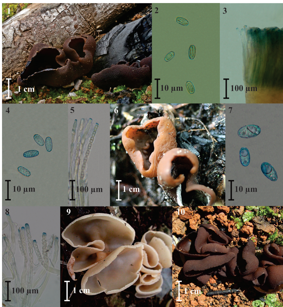
Figuras 1-10. 1-3: 1, Iodowynnea auriformis ; 2, ascosporas en azul de algodón; 3, ascas amiloides. 4-5, Peziza arvernensis ; 4, ascosporas en azul de algodón; 5, ascas amiloides. 6-8: 6, Peziza badia ; 7, ascosporas en azul de algodón; 8, ascas amiloides. 9, P. cerea. 10, P. echinospora.