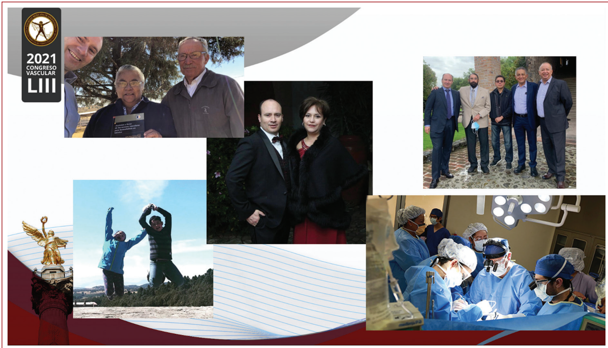
Figura 2. Familia y maestros que influenciaron en la vida profesional.