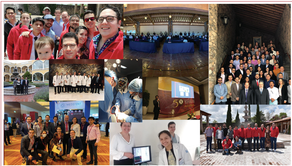
Figura 3. Equipo de Angiología, Cirugía Vascular y Endovascular del Instituto Nacional de Ciencias Médicas y Nutrición Salvador Zubirán.

nosotros doblamos, a la espera de que como sociedad tomemos realmente conciencia y, unidos, nos aboquemos a resolverlos.