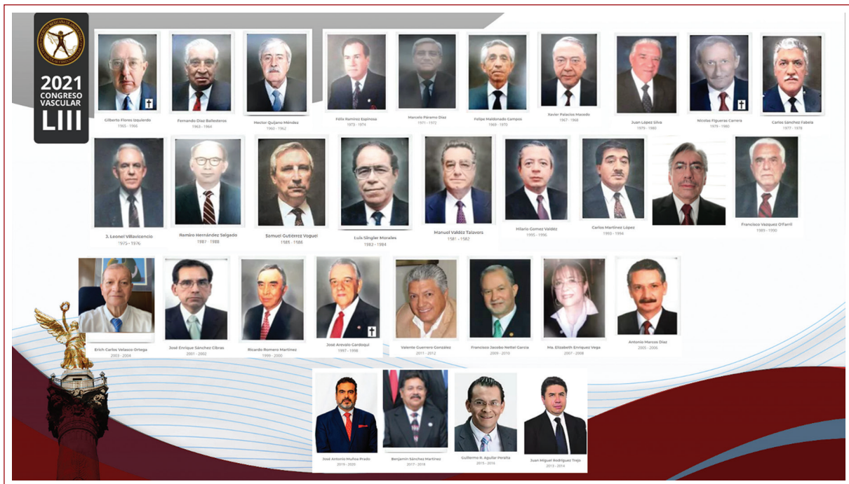
Figura 4. Expresidentes de la Sociedad Mexicana de Angiología, Cirugía Vascular y Endovascular.

Amar a la humanidad, amarnos a nosotros mismos, tendría que formar parte fundamental de las diversas soluciones que a lo largo de la historia se han ido implementando y que por diversas razones no han erradicado los componentes adversos de la sociedad.