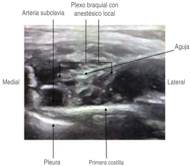
Figura 2: Plexo braquial abordaje supraclavicular. Imagen con ultrasonido en corte transversal, se observa plexo braquial: imágenes redondas hipocóicas en racimo de uvas con administración y difusión de anestésico local con punta de la aguja, técnica intracluster .

de previa antisepsia de la piel. Se utilizó un ultrasonido portátil con un transductor lineal de alta frecuencia, 8-13 MHz (SonoSite MICRO MAXX®, USA). Se coloca el transductor en la fosa supraclavicular, en un plano coronal oblicuo para obtener el mejor corte transversal del plexo braquial (imágenes redondeadas hipocóicas en racimo de uvas) a este nivel corresponde con el conjunto de divisiones anterior y posterior, en la zona latero-posterior de la arteria subclavia por encima de la primera costilla y la pleura cervical; en el sitio de punción de la piel se infiltra anestésico local, lidocaína 10% 1 mL, y con aguja (Stimuloplex® Ultra 360® Germany) de 50 mm × 22 G se introduce, de acuerdo con la técnica lineal, eje largo; la aguja se dirige de lateral a medial hasta alcanzar el plexo braquial y mantiene la pleura y la arteria subclavia siempre en la imagen, al igual que la aguja en todo momento; se visualiza la aguja cuerpo y punta; se avanza al conseguir una adecuada coordinación bimanual-visual (4) . Se coloca el anestésico local utilizando dos técnicas anatómicas: técnica corner pocket (entre la arteria subclavia, el plexo braquial y la primera costilla) y técnica intracluster (en el interior del plexo braquial). Se utilizó ropivacaína 2 mg/kg 0.5% dosis máxima 150 mg, con volumen 0.5 mL/kg, con máximo 20 mL, la cual es inyectada en tiempo real, después de prueba de aspiración negativa a contenido hemático y sin resistencia al paso del anestésico local (Figuras 1 y 2).