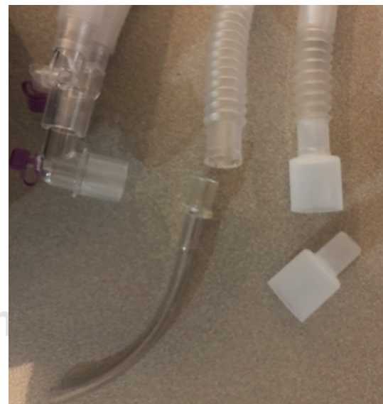
Figura 8: Deconstrucción del circuito circular al colocar un conector de sonda endotraqueal calibre 6.0 para la entrada de gases frescos (oxígeno/sevoflurano).

mento de la intubación y extubación. Otra controversia es si utilizar los dispositivos supraglóticos o cánula endotraqueal para el manejo de la vía aérea. Al respecto continuamos aprendiendo, pues aún no hay estudios con evidencia científica. Con base en la experiencia adquirida en estos seis meses de la pandemia, podríamos decir que sí hay evidencia de que la intubación de secuencia rápida es lo recomendable. El manejo farmacológico debe adecuarse de manera individualizada a cada escenario clínico al que nos enfrentemos, considerando la hemodinamia, el compromiso pulmonar, la respuesta inflamatoria sistémica, el comportamiento hematológico y, en general, el estado integral de cada paciente.