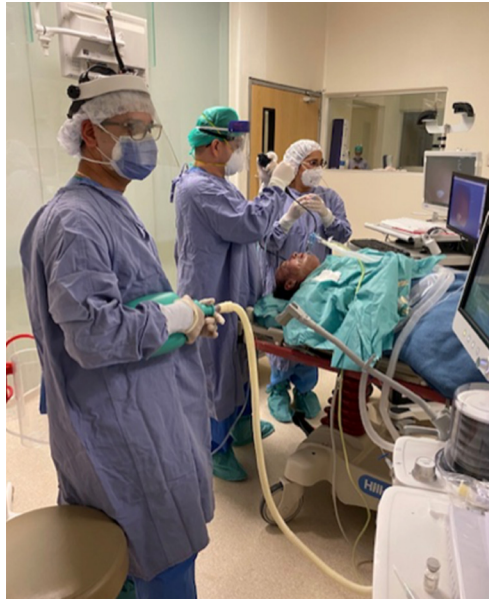
Figura 3: Sala de endoscopia.