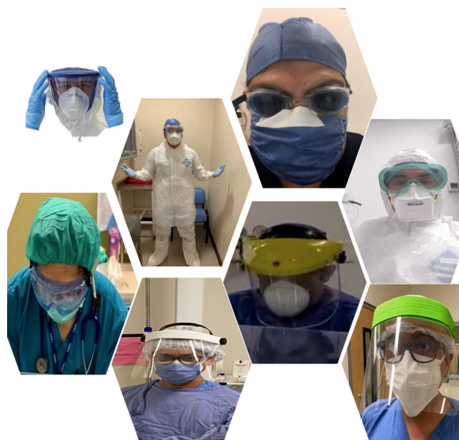
Figura 6: Reconversión del anestesiólogo.

Para el caso del paciente pediátrico, se ha determinado realizar la imagen de resonancia magnética (IRM) en aquellos pacientes en los que no es posible suspender la continuidad de su tratamiento (seguimiento de diagnósticos de epilepsia, postratamiento gamma knife y «estatus» convulsivo). Se debe realizar un interrogatorio a modo de «valoración preanestésica» vía telefónica, previamente a la programación; éste se corroborará el día del estudio. En dicho protocolo, se establece un esquema de ayuno de acuerdo con la edad del paciente. Se recomienda a los padres del paciente que programen el estudio a primera hora de la mañana para aprovechar la sanitización del equipo (contra