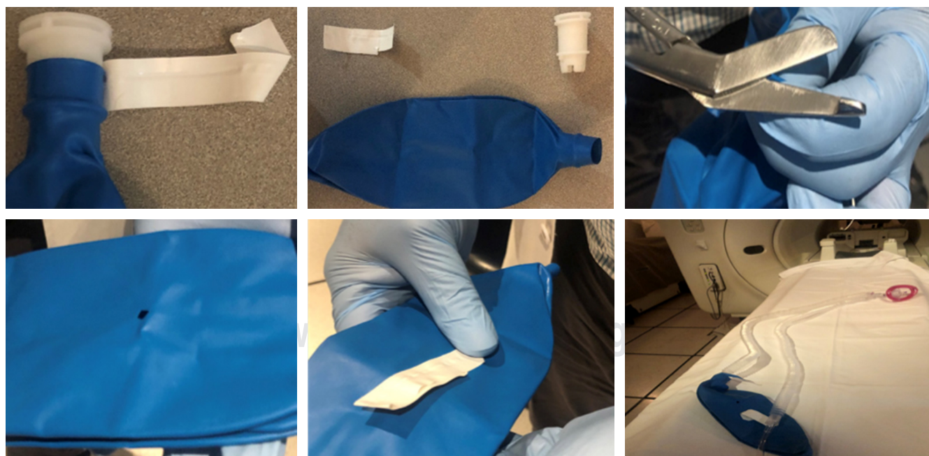
Figura 9: Deconstrucción de la bolsa reservorio con un pequeño orificio (válvula espiratoria) que se inserta en el extremo para cerrar el circuito circular.

No obstante, es muy difícil que en procedimientos de NORA las salas cumplan este requisito. Por tanto, se debe realizar lavado de manos y cambio de ropa; además se