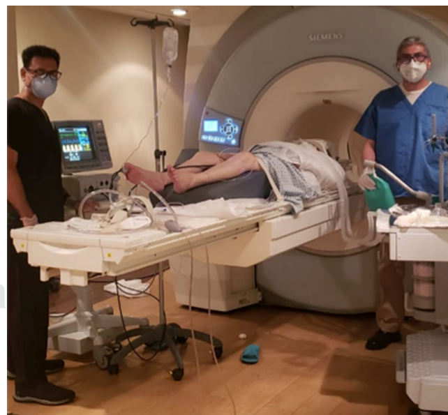
Figura 2: Unidad de resonancia magnética sin EPP.

En México, la Norma Oficial Mexicana (NOM-006-SSA3-2011) para la Práctica de la Anestesiología (5) previene que los establecimientos prestadores de servicios de atención médica y en los cuales se practique la anestesiología fuera de quirófano deben reunir un mínimo de requisitos en materia de equipamiento ( Tabla 1 ).