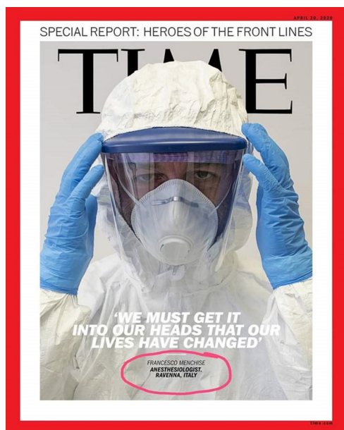
Figura 5: «Nos cambió la vida».

paciente va a ser intervenido quirúrgicamente, poniendo especial atención en los signos y síntomas sugerentes de la infección y haciendo hincapié en los antecedentes de posibles contactos con algún infectado. Debe plantearse al paciente o responsable legal de éste el plan de manejo, los riesgos, el tiempo de ayuno, según sea el caso, firmar el consentimiento informado (anexar los riesgos asociados con COVID-19) y se deberán solicitar los estudios de laboratorio apropiados para cada caso en particular (acordes con las necesidades del paciente, con el acto médico a realizar y con el protocolo de estudio respectivo). Actualmente, se debe incluir la prueba de COVID-19 con un máximo de 72 horas de vigencia. No está por demás informar que ciertas patologías implican la administración de material de con-