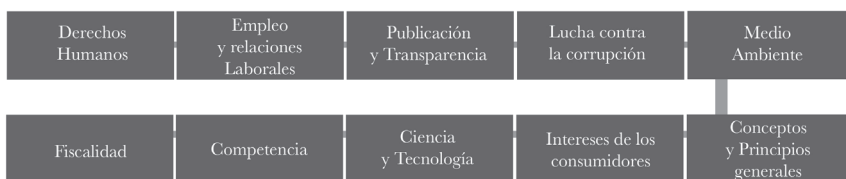
FIGURA 1. LÍNEAS DIRECTRICES OCDE