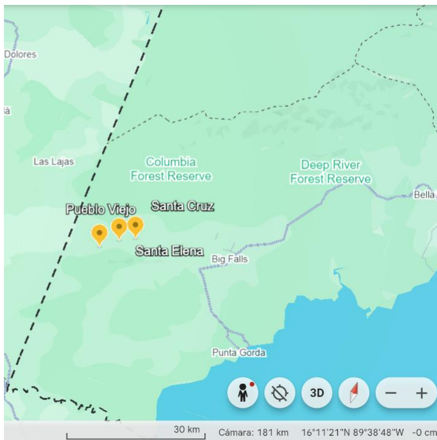
Figura 1. Sur de Belice, aldeas de Santa Elena, Pueblo Viejo y Santa Cruz