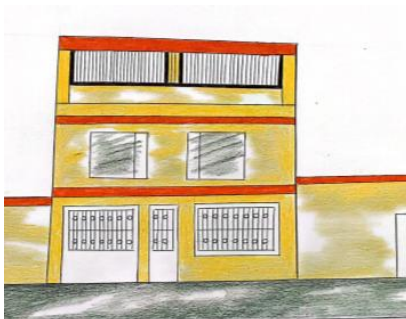
Figura 5. Casa citadina en Colombia

Fuente: Paula Andrea Parra, estudiante de Lea-Ud. Agosto de 2024