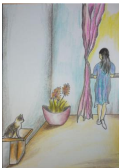
Figura 3. Habitación con muchacha, gato y planta