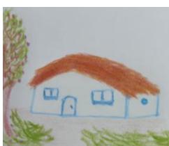
Figura 4. Casa campesina

Fuente: Paula Andrea Parra, estudiante de Lea-Ud. Agosto de 2024