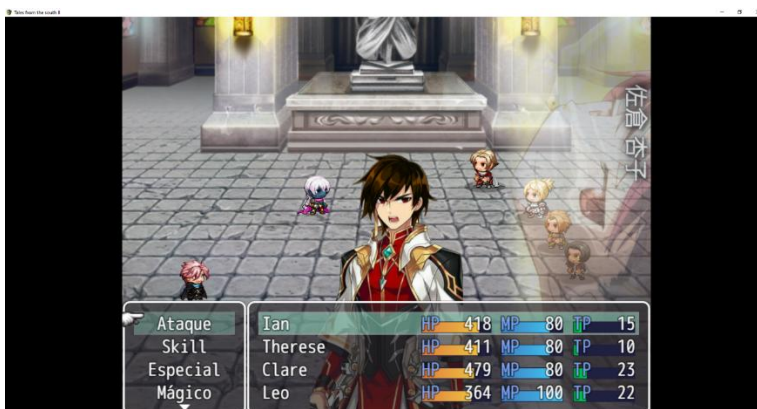
Figura 3: Combates dinámicos