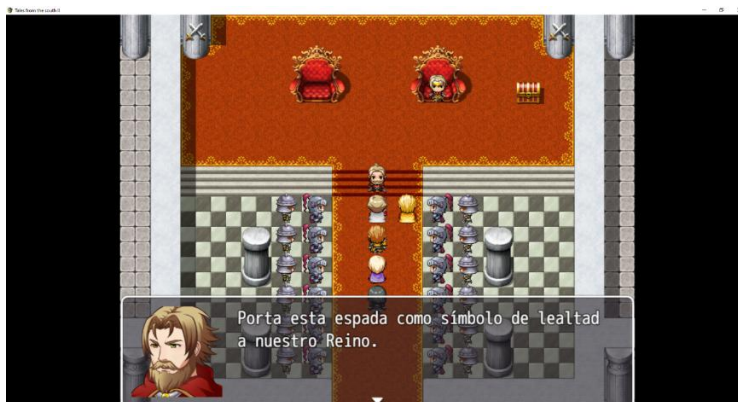
Figura 2. Acontecimiento, ascenso a capitán.