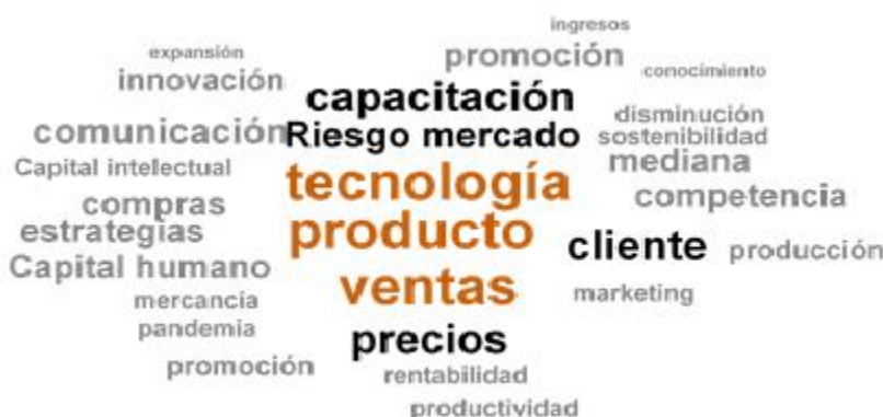
Figura 3. Nube de palabras creada con NVIVO 12.