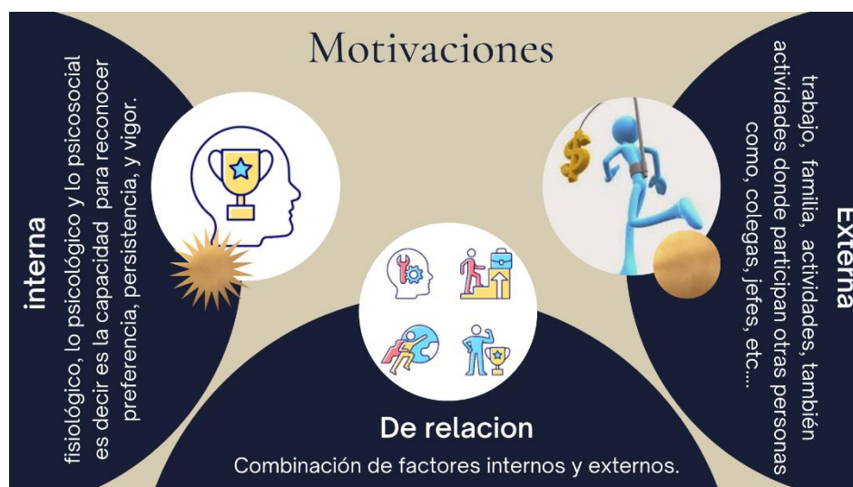
Figura 3. Tipos de motivaciones en los estudiantes