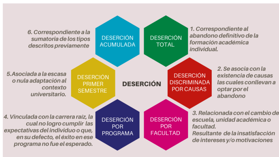
Figura 2. Categorías de deserción