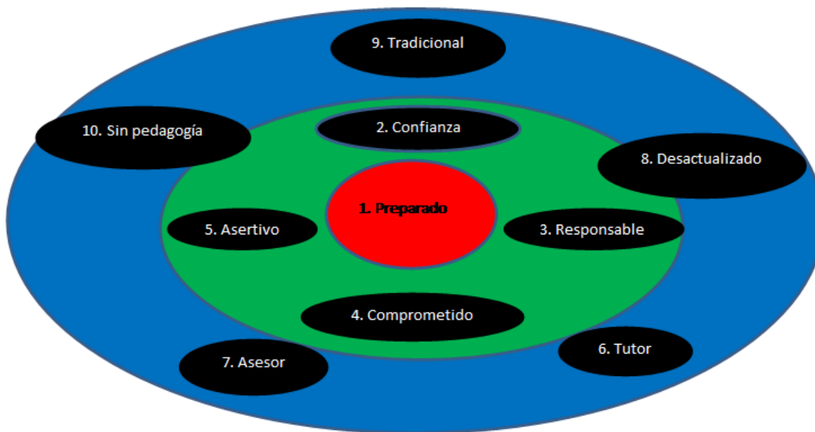
Figura 1. Núcleo central de la red, peso y distancia del sistema periférico de las representaciones sociales de la docencia universitaria