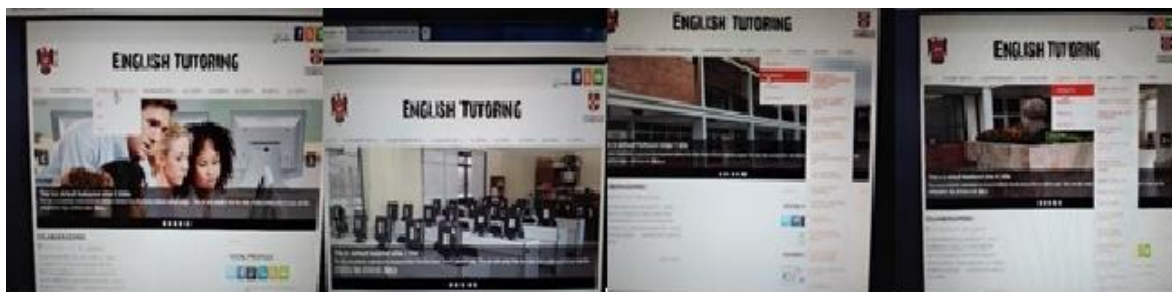
Figura 5. Imágenes de pantalla de la suite interna de autoría propia, en Wordpress