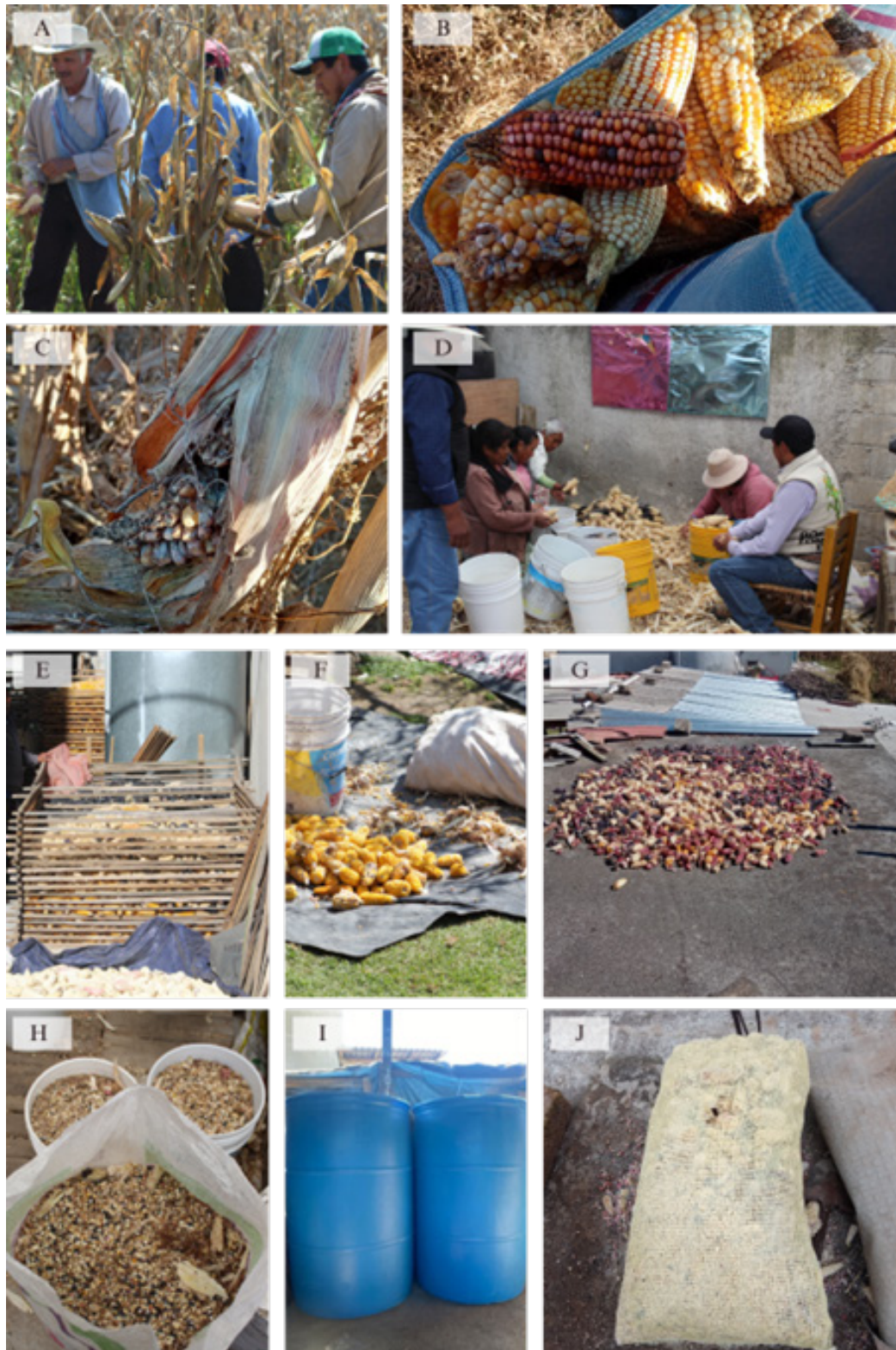
Figura 2. Manejo de la granza de maíz nativo: A) cosecha del maíz, B) mazorcas cosechadas en buen estado y dañadas, C) mazorca con daño severo que se dejan en la milpa, D) limpieza y selección del maíz, E) secado de la granza en cincolote, F) secado de la granza en el patio familiar sobre un plástico, G) secado de la granza en la losa de la casa, H) granza almacenada en costales de rafia y botes de plástico, I) tambos de plástico donde se almacena la granza, J) granza almacenada en arpilla.