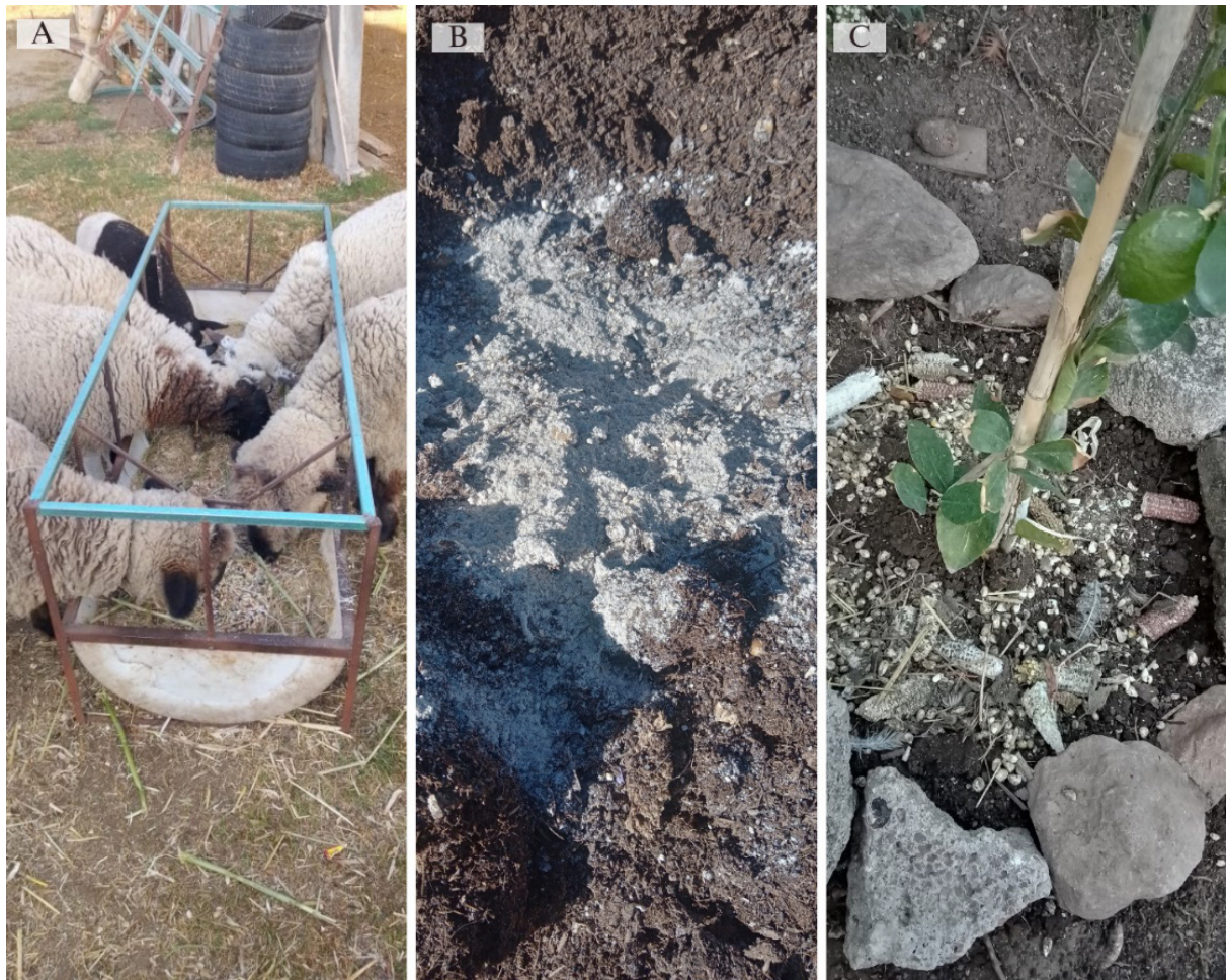
Figura 3. Uso de la granza de maíz nativo: A) alimentación animal, B) insumo en la composta y C) abono para árboles frutales.

como cuarta acción utilizar guantes y cubrebocas para evitar el contacto directo con el polvo y los hongos de las mazorcas dañadas, así como la inhalación de posibles esporas que podrían causar problemas en su salud, tal como lo reportan Janik et al. (2020).