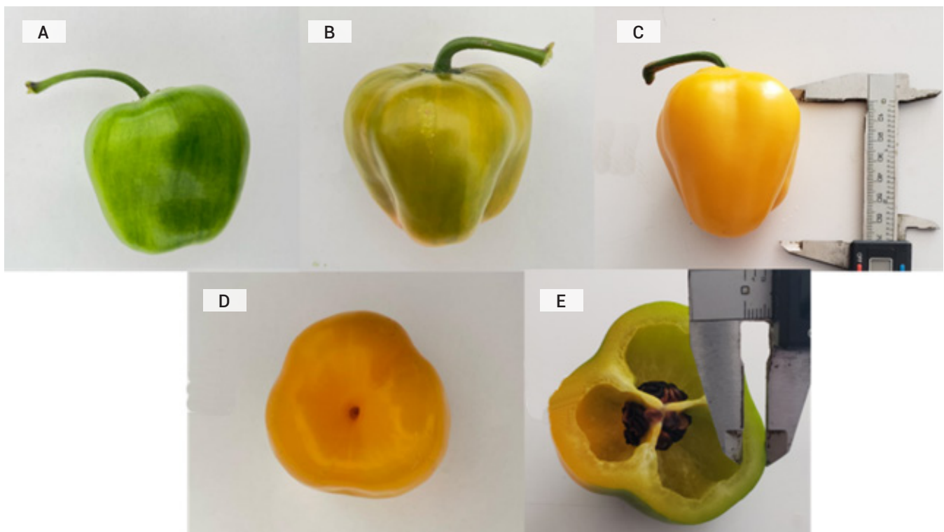
Figura 2. Características del fruto de chile manzano variedad Mayito. A) color verde claro al inicio de madurez, B) forma trapezoidal, C) color amarillo con intensidad media a la madurez, D) ápice poco profundo y E) predominantemente de tres lóculos.

1F), mientras que el estilo es de intensidad media. El fruto, al inicio de la madurez, es de color verde claro (Figura 2A) y tiene tamaño medio, con forma trapezoidal (Figura 2B), y a medida que madura su color cambia a amarillo con intensidad media (Figura 2C); el ápice es poco profundo