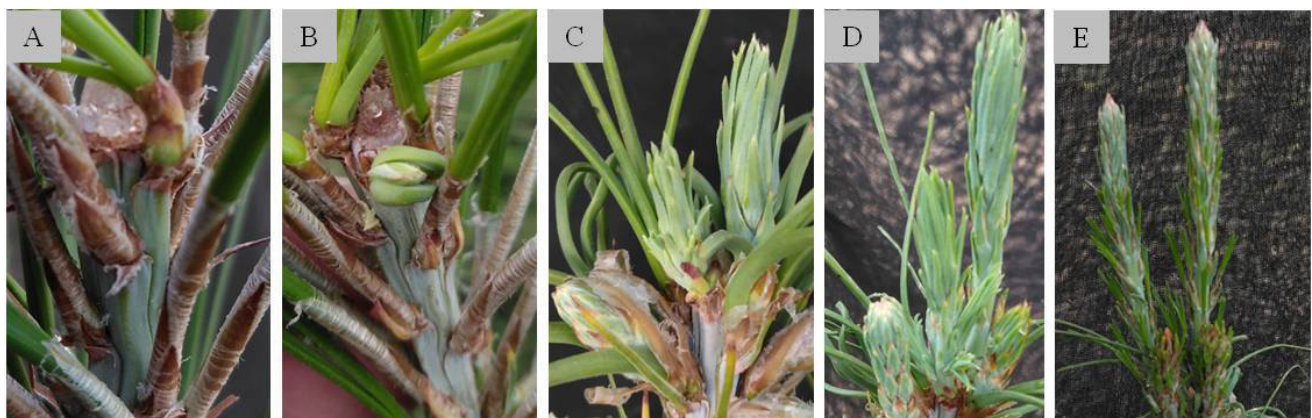
Figura 1. Fenología de brotes a partir de plantas madre injertadas de P. patula . A) semanas 2-6, abultamiento en la base de algunos fascículos cercanos al área de poda, B) semana 7, inicio de la brotación, C) y D) semanas 8-14 crecimiento en longitud de los brotes y desarrollo de acículas primarias, E) semana 16 reducción de crecimiento e inicio de hojas secundarias (acículas unidas al fascículo).

Se utilizó un diseño experimental de bloques completos