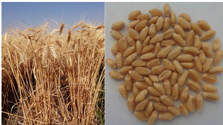
Figura 1. Porte de planta y grano de la variedad de trigo harinero Hans F2019.

La liberación de Hans F2019 servirá para sustituir al primer grupo de variedades testigo que aún se siembran en