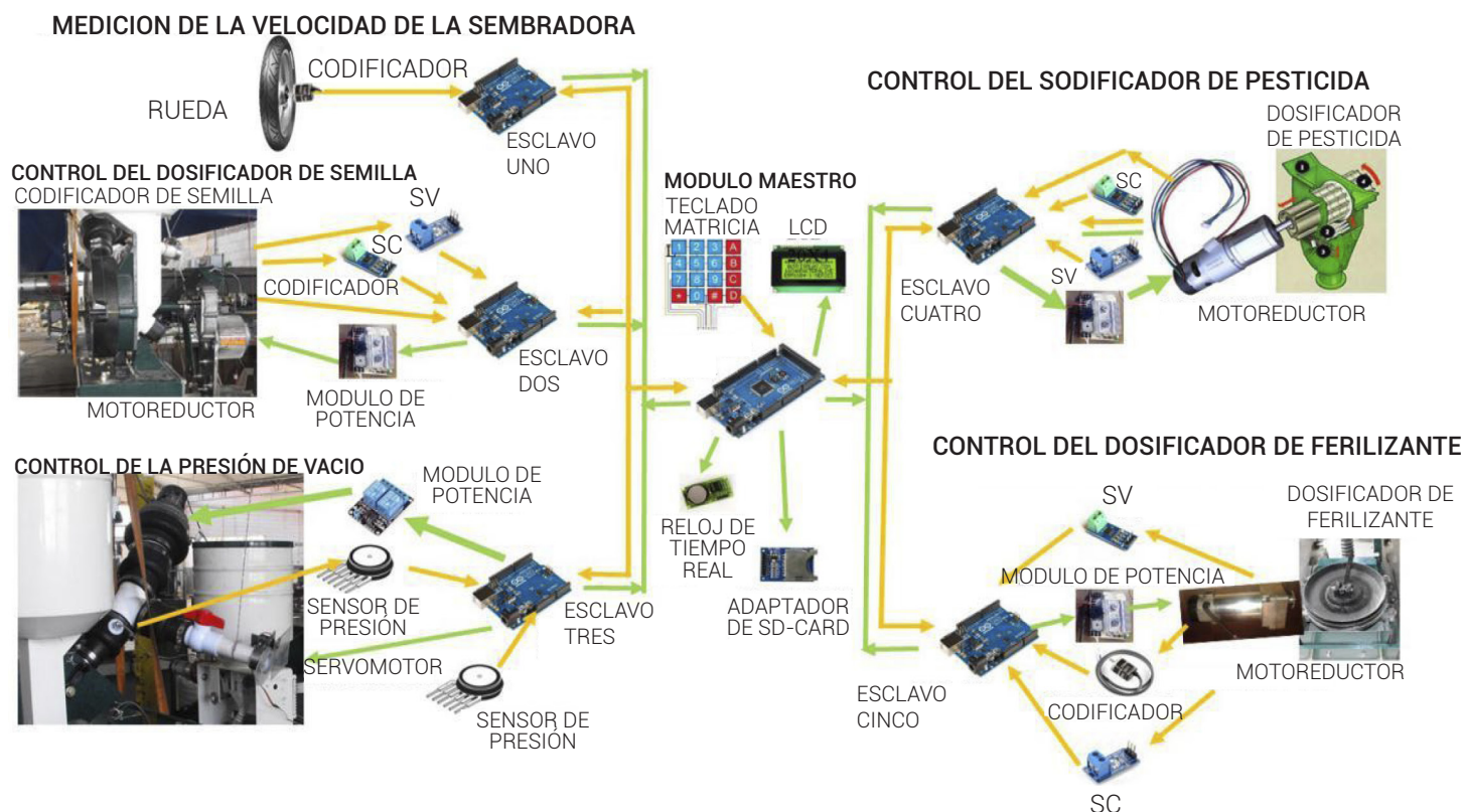
Figura 2. Sistema mecatrónico diseñado para la sembradora-fertilizadora.