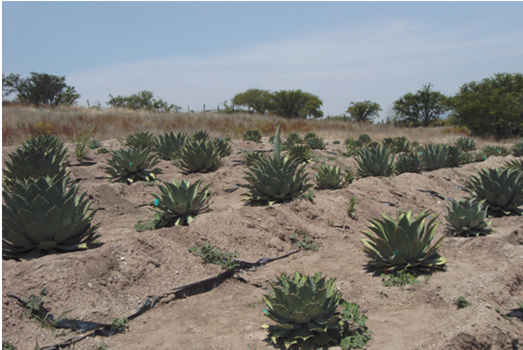
Figura 1. Plantación experimental de Agave potatorum Zucc. en San Pedro Yodoyuxi, Huajuapán de León, Oaxaca.

(sulfato de potasio). La distancia entre plantas fue de 2.5 m y de 3 m entre hileras, densidad equivalente a 1320 plantas \text{ha}^{-1} . Para cada planta se construyó una terraza individual de 1 \text{m}^2 , de sección circular, con un bordo de tierra de 15 cm de altura. La fertilización nitrogenada se hizo el 30 de junio de 2008, una vez que se estableció el periodo de lluvias; se empleó sulfato de amonio que se distribuyó al voleo en la terraza individual, alrededor de la planta, y se incorporó manualmente en los primeros 5 cm de la capa de suelo. El tratamiento de riego se inició el 15 de octubre de 2008, una semana después de haber concluido el periodo de lluvias. Con un recipiente debidamente aforado se aplicaron 10 L de agua por planta.