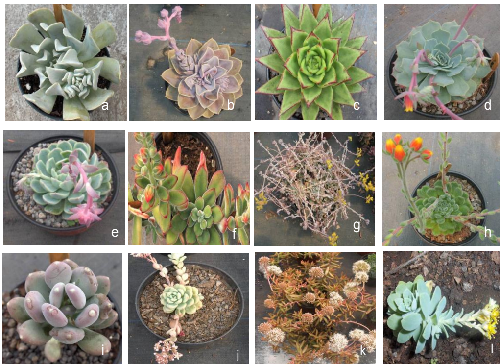
Figure 1. Studied species of the Crassulaceae family. a: Echeveria runyonii topsy-turvy, b: E. perle von nuremberg, c: E. agavoides Lem., d: E. pumila var. glauca x E. Walther. , e: E. elegans Rose, f: E. pulvinata , g: E. derembergii , h: E. setosa Rose & J.A. Purpus, i: Pachyphytum oviferum J.A. Purpus, j: Sedum clavatum , k: S. nussbaumerianum Bitter, l: S. palmeri S. Watson.

Figura 1. Especies de la familia Crassulaceae estudiadas. a: Echeveria runyonii topsy-turvy, b: E. perle von nuremberg, c: E. agavoides Lem., d: E. pumila var. glauca x E. Walther. , e: E. elegans Rose, f: E. pulvinata , g: E. derembergii , h: E. setosa Rose & J.A. Purpus, i: Pachyphytum oviferum J.A. Purpus, j: Sedum clavatum , k: S. nussbaumerianum Bitter, l: S. palmeri S. Watson.