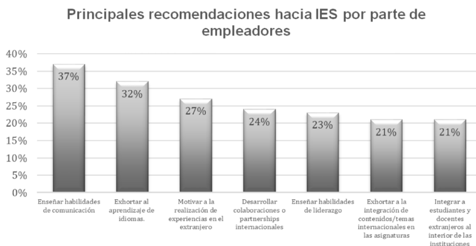
Figura 2. Recomendaciones de empleadores hacia las instituciones educativas Elaboración propia. Fuente: Reporte “Culture at Work” (Pressley y Beall, 2013).

Dentro de este informe, adicionalmente, se establecieron algunas recomendaciones de empleadores hacia las instituciones educativas con el fin de mejorar el desarrollo de las competencias de los futuros profesionistas. La figura 2 presenta de forma gráfica las recomendaciones, así como la frecuencia con la que dicha recomendación fue mencionada, respecto a la muestra encuestada: