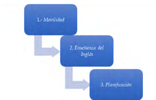
Gráfico 2. Jerarquía de las orientaciones

Para jerarquizar las orientaciones de cada universidad de acuerdo a la evidencia resultante de la aplicación del CVI se consideraron las puntuaciones más altas obtenidas en cada una de las dimensiones del CVI. En el Gráfico 2, se muestran las principales orientaciones encontradas en los PEI.