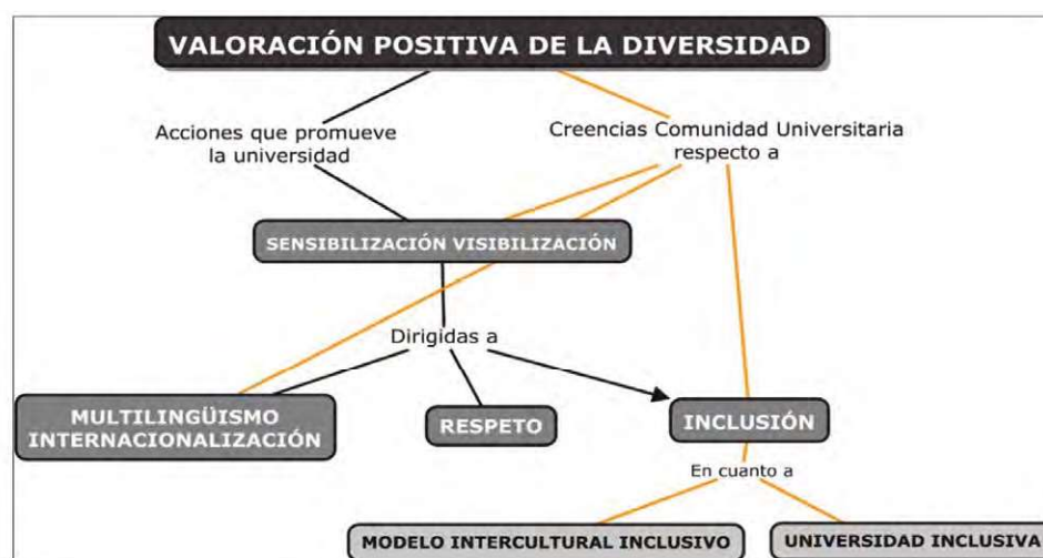
Figura 3. Valoración positiva de la diversidad

La política no es que vayan aflorando los diferentes colectivos, pero cuando lo hacen sí que intentamos ser sensibles a esas necesidades (E_VR3).