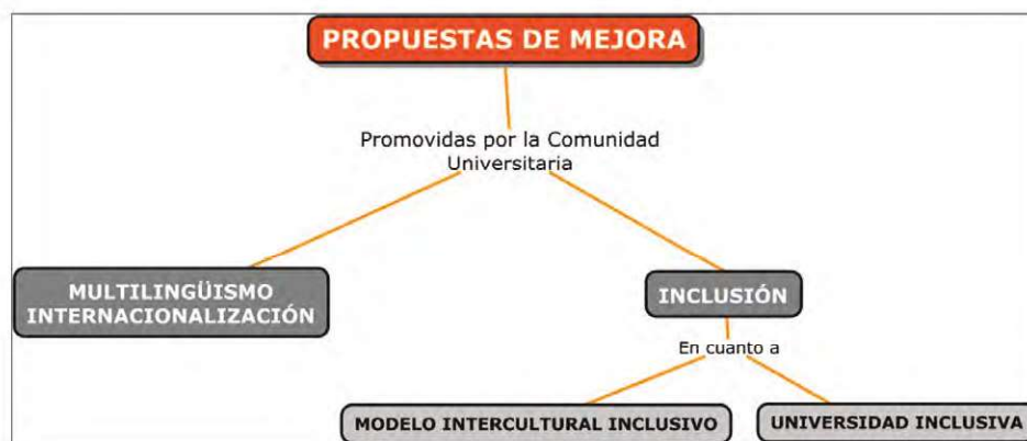
Figura 4. Propuestas de mejora

La segunda propuesta de mejora hace referencia a eliminar tensiones con el Multilingüismo y la Internacionalización. Los estudiantes consideran que es necesario abordar la multiculturalidad con mayor apertura y aprovechar el intercambio cultural como un enriquecimiento. Respecto al multilingüismo es importante acercar visiones y trabajar el tema