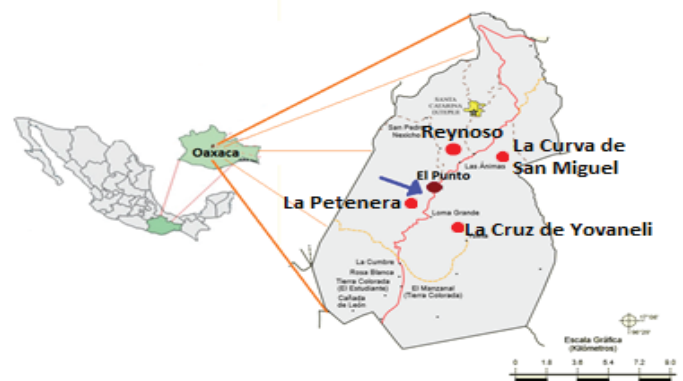
Figura 1. Localización y colindancias de la comunidad de “El Punto”, Santa Catarina Ixtepeji, Oaxaca. (INEGI, 2005).

Study area. El Punto is a Municipal Agency that belongs to the Municipality of Santa Catarina Ixtepeji, and to the District of Ixtlán de Juárez (Figure 1). Its geographical coordinates are 96^{\circ} 35' 2'' north latitude and 17^{\circ} 13' 18'' west longitude at a height of 2 304 m. Its population is 501 inhabitants, of which 44% are men and 56% are women. 6% of the population speaks an indigenous language, has an average of 7 years of schooling and 2% of them did not go to the school. The economically active population is 52% (INEGI, 2010).