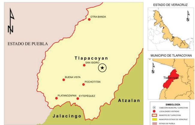
Figura 1. Comunidades visitadas que tienen el sistema agroforestal tradicional café-plátano-cítricos en el municipio de Tlapacoyan, Veracruz (Cruz et al. , 2015).

plot and in the homes of the producers. The surveys were emptied in a database. Family production units (UPF) were classified based on the surface of the earth, the amount of labor they have available and the level of equipment and modernization.