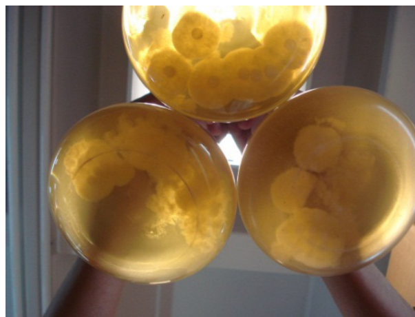
Figura 1. Cultivo de P. cinnamomi , aislamiento CPO-PCU, en medio líquido jugo-V8®.

As inoculum source an isolate of P. cinnamomi CPO-PCU was used (for short log in Genbank: Graduate College- Phytophthora cinnamomi -Uruapan, Genbank accession number JQ266267) very virulent, isolated from avocado roots of an orchard located in Uruapan, Michoacán, Mexico. The oomycete was reactivated in V8® agar juice at 28 °C for 8 days. Subsequently, 10 slices of the culture medium of 5 mm diameter were transferred to 500 mL flasks with liquid medium-V8® agar juice (Figure 1) and incubated at 28 °C. Ten days after incubation and oomycete multiplication, proceeded to quantify the number of mycelium fragments per milliliter with a hemacytometer.