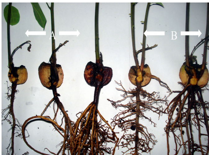
Figura 3. A) totipotencialidad en plántulas de Atlixco y; B) totipotencialidad en plántulas de Tepeyanco con 5 cm de altura, 10 días después de la inoculación con P. cinnamomi .

La inoculación en plántulas de 5 cm de altura estimuló la totipotencialidad (capacidad de rebrotación). En la Figura 3, se muestra la muerte de la primera plántula tras la inoculación con P. cinnamomi y la formación del nuevo brote con el desarrollo de una raíz principal y raíces adventicias vigorosas. La capacidad de regenerar nuevas raíces en estos genotipos es un mecanismo de respuesta de resistencia genética basada en la supervivencia y capacidad totipotencial ante la inoculación de plántulas con el patógeno. Esta respuesta de la plántulas se puede observar cuando las plántulas o portainjertos provienen principalmente de semillas de raza Mexicana. Por lo anterior, la mayoría de los árboles de aguacate en Australia y México están injertados sobre portainjertos de semillas procedentes de árboles de polinización libre, de raza Mexicana, que provee la posibilidad de que exista una variación genética en sus huertos para la selección de resistencia a P. cinnamomi . Pegg et al. (2008) mencionan que los portainjertos australianos cultivar Thomas y genotipo de raza Mexicana como Duke sobreviven y prosperan en condiciones de alta presión de inóculo debido a la capacidad de los portainjertos para regenerar rápidamente nuevas raíces.