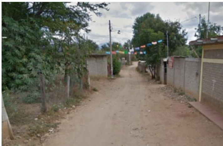
Figura 2. Medio natural de la zona centro del SMTO.

Se conoció que la infraestructura y servicios son mínimos en la comunidad, las calles carecen de pavimentación y se tiene un centro de salud para dar atención a la población. Conforme a información obtenida de las entrevistas realizadas a funcionarios de esta clínica, existe un aumento de los casos de enfermedades principalmente de tipo gastrointestinal debido a la carencia de infraestructura para el saneamiento de las aguas residuales (Gobierno del Estado de Oaxaca, 2013).