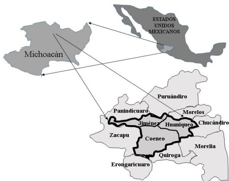
Figura 1. Ubicación y colindancia del PRODETER-Lenteja en el estado de Michoacán.

Geográficamente los municipios se ubican en 19° 48' latitud norte y 101° 35' longitud oeste para Coeneo, en 19° 54' latitud norte y 101° 30' longitud oeste para Huaniqueo y 55° latitud norte y en 101° 45' longitud oeste para Jiménez. Respecto al relieve los primeros presentan una altitud de 2 040 m y el último a 2 020 m, todos con clima templado y lluvias en verano, con una temperatura promedio anual de 8 a 25 °C y una precipitación de 816, 850 y 760-900 mm, respectivamente (INEGI, 2009a, 2009b, 2009c; INAFED, 2019a, 2019b, 2019c).