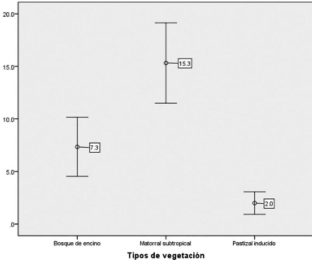
Figura 2. Densidad promedio de venados en la Sierra del Laurel, Aguascalientes, con intervalos de confianza de Wald al 95 %.