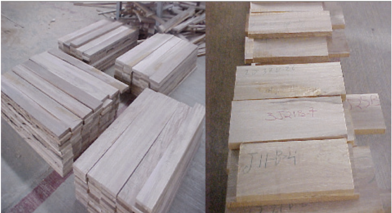
Figura 2. Elaboración de probetas de ensayo. Figure 2. Manufacturing of wooden assay test pieces.

For planing was used a turning speed of the portable blade head of 5 500 rpm and two feeding speeds: 13 and 7.5 m min -1 to 16.9 and 29.3 marks of the blade by centimeter, each, combined with four cutting angles: 15, 20, 25 and 30 degrees; in boring two turning speeds of the head were tested: 1 300 y 2 500 rpm; in molduring was applied a turning speed to the tool-portable