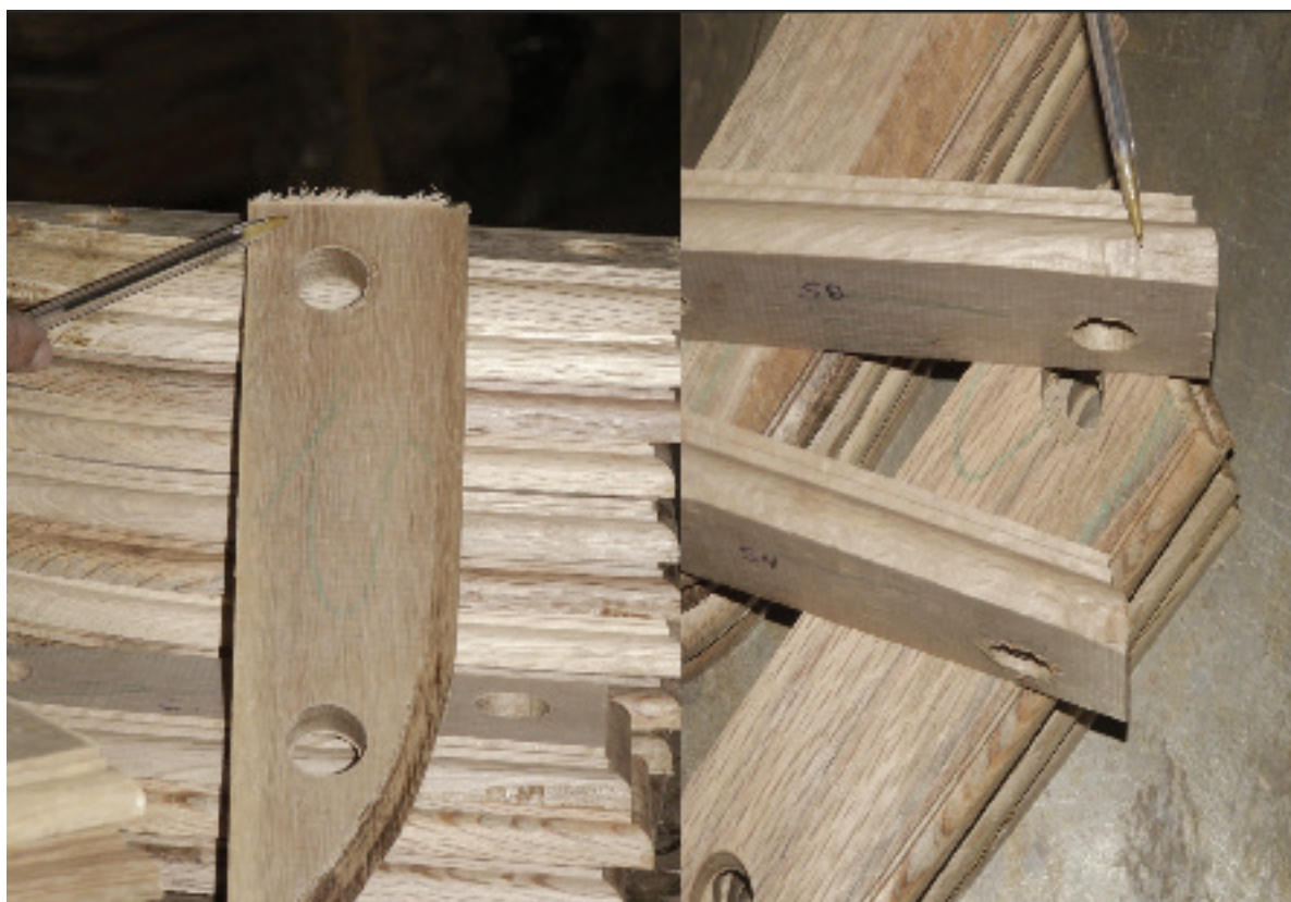
Figura 3. Defectos de grano: (a) apelmusado y (b) astillado. Figure 3. Defects of grain (a) fuzzied and (b) splintered grain.

In the assessment of the quality of wood machining it was considered the sum of the percentage of excellent (E) and good pieces (B), according to the classification in Table 2. In the turning assay, the percentage of wood tests classified as regular was also included, according to the regulation previously quoted.