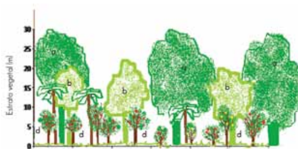
Figura 2. Estructura vegetal en el sistema agroforestal de café bajo sombra y distribución de: a) Inga jinicuil Schltld., b) Trema micrantha (L.) Blume, c) Cecropia obtusifolia Bertol. y d) Coffea arabica L.

17 associated firewood species were identified, with densities from 20 to 1,000 plants ha -1 (Table 1). The size of the individuals had a range from 1 to 27 m tall. In general terms, the species mostly used as shadow canopy for coffee plants was I. jinicuil , which was recorded in 90 % of sites, at an average density of 164 trees ha -1 . Their basal diameter varied from 5 to 80 cm, their crown diameter from 5 to 27 m and their height between 3 and 17 m; 58 % of the trees reached 5 and 10 m (Figure 2). When Inga sp. trees in Oaxaca were assessed by Acosta-Mireles et al. (2002), they determined an average biomass per tree of 94.5 kg and a normal diameter of 15 cm, by allometric relations.