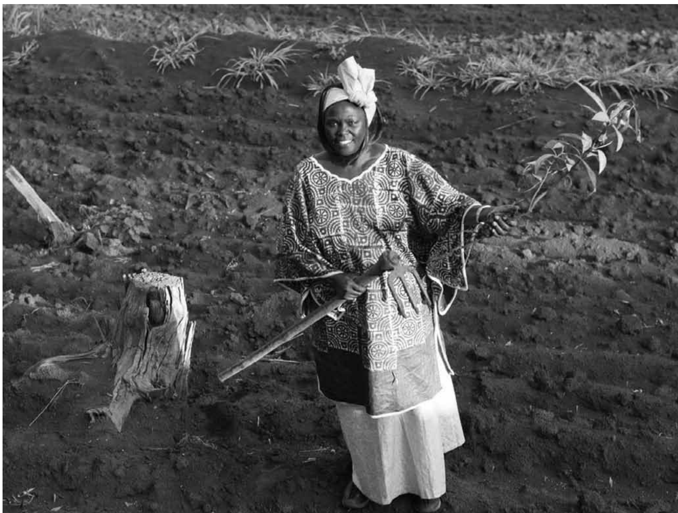
Wangari Muta Maathai.