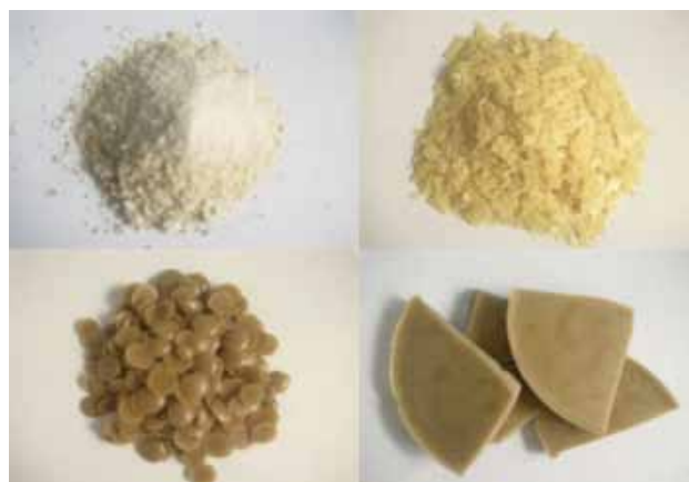
Figura 2. Cera de candelilla en diferentes presentaciones. Figure 2. Different presentations of candelilla wax.

Its chemical structure consists of esters of fatty and acid long chain fatty acids of (Table 1). Although, there are other plants capable of generating "wax" ( Pedilanthus pavonis Boissier and Pedilanthus aphyllus Boissier), they are less effective; as well as having lower saponification value points and fusion, compared with the produced by individuals of the genus Euphorbia (IC, 2008; Multiceras, 2007; Maldonado, 1979). Also, the journal of the Royal Society of Arts stated that the candelilla plant contains high quality wax and in enough amount for harvesting, which makes it a very valuable species; however, after many years of collecting it, two unchanged factors persist: the extraction process and the conditions of extreme poverty of the inhabitants of the candelilla zone (CENAMEX, 2007).