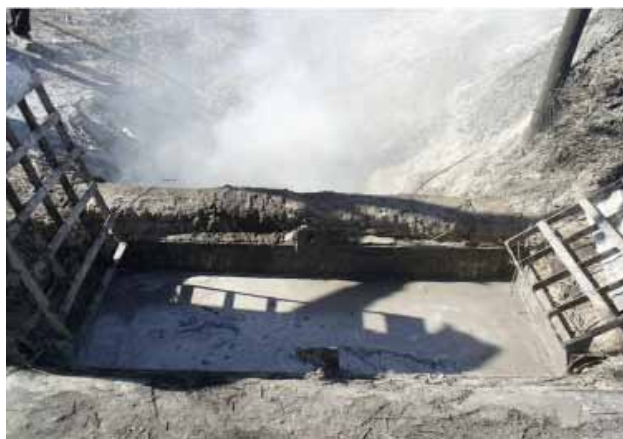
Figura 4. Caldero de hierro denominado "paila", en donde se lleva a cabo el proceso de extracción de cera de candelilla.

Sulphuric acid prevents that wax adheres to impurities and forms an emulsion, which could generate in the turbulence conditions during the boiling process. By using this technique, candelilla melted wax floats on the water surface as a foam, and then, immediately, it is removed from the "paila" with utensils that have holes, called "espumaderas" ("foamers"), with which the wax is taken to steel tanks, buckets with conic holes or clay molds that are placed at ground level. In any of the containers, the hot foam (wax) is separated by decanting it from a brown liquor which precipitates towards the bottom, to be recycled in the extraction "paila" later.