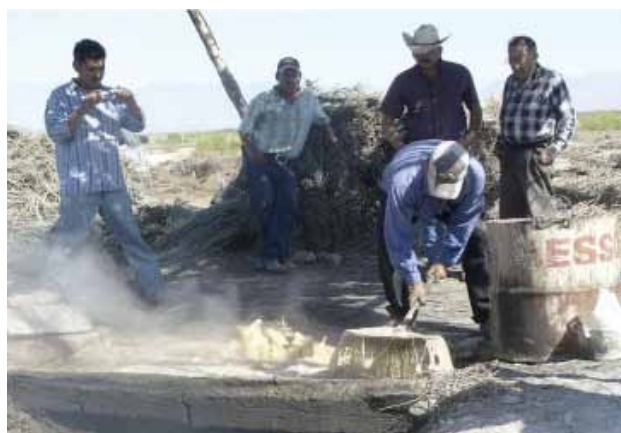
Figura 5. Separación de cerote.

En la industria de los cosméticos, dadas sus propiedades protectoras, la cera de candelilla es indispensable para una gama importante de formulaciones utilizadas en la producción de lápices labiales, cremas corporales y preparaciones para el cabello. Por ser un buen plastificante y por sus capacidad de retención de aceites esenciales, favorece la preservación de los sabores, se utiliza en la fabricación de goma de mascar. Existen otras aplicaciones que incluyen recubrimientos para cartón y papel, industria de crayones, pinturas, velas de cera, lubricantes, adhesivos, anticorrosivos, fármacos, lubricantes, plásticos, textiles, tintas, anticorrosivos, impermeabilizantes y fuegos artificiales, etc (SEMARNAT, 2008).