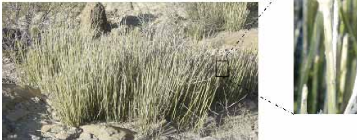
Figura 1. Arbusto de candelilla ( Euphorbia antisiphilitica Zucc) (a). Detalles del tallo (b). Figure 1. Candelilla shrub ( Euphorbia antisiphilitica Zucc) (a). Details of the stem (b).

los incendios pueden llegar a poner en peligro sus poblaciones (CONAFOR, 2009).