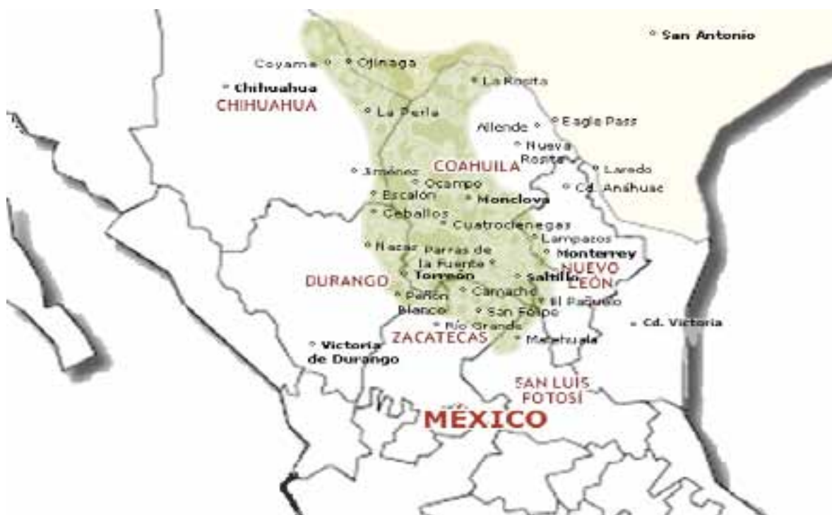
Figura 3. Región candelillera en el semidesierto mexicano. Figure 3. Candelilla zone in the Mexican semi-desert region.

It consists of placing the plant of candelilla in iron cauldrons called "pailas", adding a 0.3% (v/v) sulphuric acid solution (Figure 4); sulphuric acid used is a waste of the industry of fertilizers, according to testimony from the candelilleros. A "third" is the unit of measure equivalent to a "brazada" (all that can be taken between open arms), which is equivalent from 24 to 32 kg of the plant; this variation is explained by the moisture content of the plants. Each paila has a 500 L capacity, where eight "thirds" (192 to 256 kg) by extraction of candelilla or "pailada" are put. The load of candelilla that is immersed in a water-acid solution, is heated up to the boiling point. This favors detachment of wax from the plant its the merging (De León-Zapata, 2008; Saucedo-Pompa et al. , 2009).