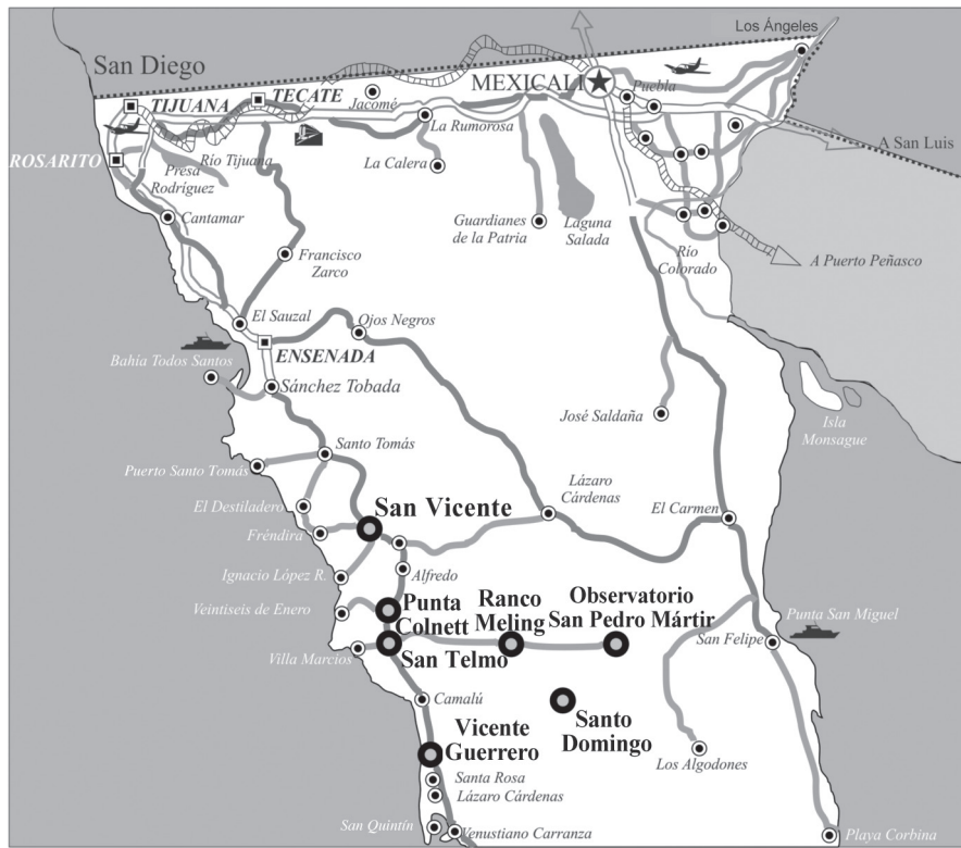
Figura 1 Localización del rancho Meling y los sitios mencionados en el artículo