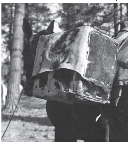
Caballo equipado con alforja de piel vaquera, preparado para viaje a la sierra de San Pedro Mártir.