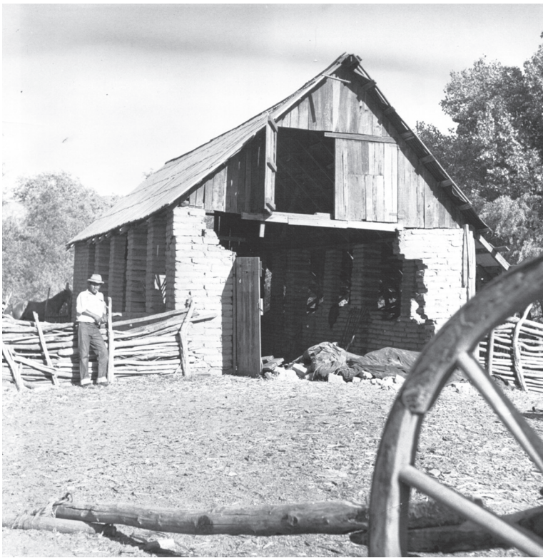
Eulogio Pompa descansando en las caballerizas, 1950 (archivo familiar).