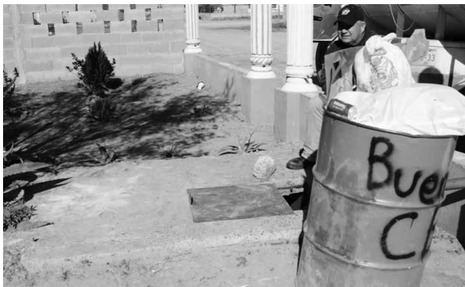
FOTOGRAFÍA 5. CESTO DE BASURA SOBRE LA CISTERNA

Esa problemática se observó en las viviendas. En algunos casos, las cisternas son de construcción rústica o carecen de un sistema apropiado de tapado. En una de las casas, incluso, se observó que los cestos de basura están sobre la tapa de la cisterna, lo que puede ocasionar la contaminación del agua por los posibles escurrimientos de los líquidos residuales de los desechos domésticos (véase la fotografía 5). En las visitas se constató que en ciertas viviendas el agua almacenada en los recipientes tenía ese color verdoso, tierra diluida o había mosquitos y muchos de los recipientes estaban sucios.