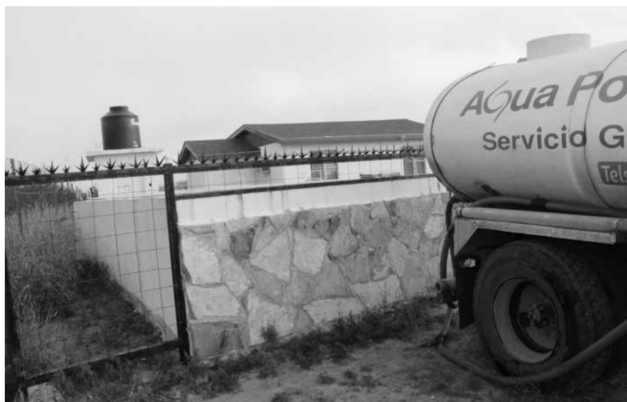
FOTOGRAFÍA 2. CISTERNAS PARA ACAPARAR AGUA