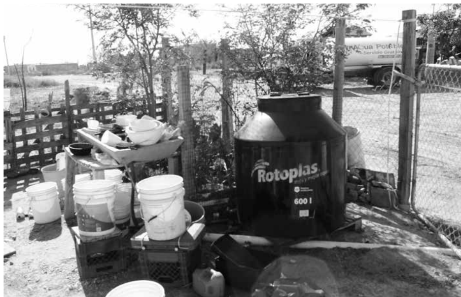
FOTOGRAFÍA 1. RECIPIENTES PARA ACAPARAR AGUA

A la población de los asentamientos irregulares se les abastece el agua a través del servicio de pipas municipales. Para ello, el Departamento de Distribución de Agua Municipal cuenta con 10 pipas, y en la temporada de calor renta otras cuatro o cinco a proveedores particulares, sobre todo de mayo a agosto, meses en los que aumenta la demanda de agua. Cada pipa de este Departamento tiene una capacidad de 8 000 litros y cada una de las rentadas de 16 000 litros. Son 31 o 32 sectores los que atiende el Departamento, y se trata tanto de asentamientos irregulares sin el servicio como de ya regularizados que no tienen la infraestructura para esos servicios. Se les suministra 2 000 litros de agua por vivienda una vez por semana.