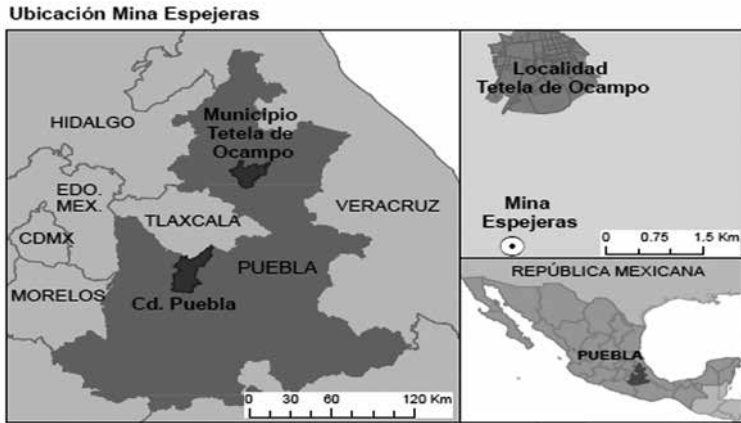
FIGURA 2. UBICACIÓN DE MINA ESPEJERAS