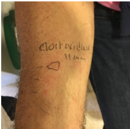
Figura 1. Prueba de punción cutánea positiva para clorhexidina a 0.5 %.

Las reacciones alérgicas van desde la urticaria hasta la anafilaxia, esta última se ha reportado con la aplicación tópica (cutánea, oftálmica, uretral) y