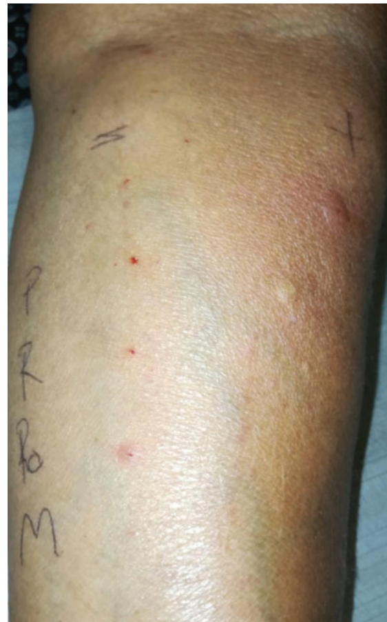
Figura 2. Punción cutánea + histamina (control positivo), solución salina (control negativo), P = propofol, M = midazolam, RO = rocuronio, R = rupivacaína.

En el periodo de estudio se registraron 32 casos de alergia perioperatoria; fueron eliminados dos pacientes por no aceptar los procedimientos de pruebas cutáneas y dos al no acudir a la realización de las