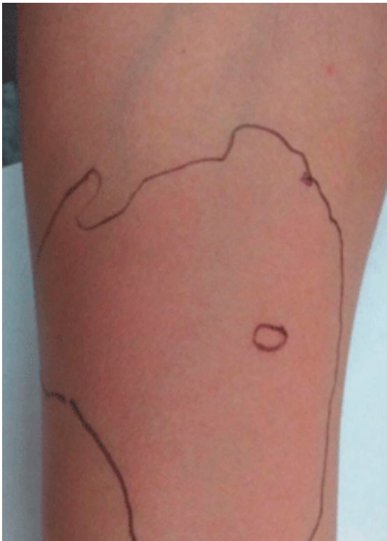
Figura 2. Reacción cutánea (técnica de punción) a psyllium: eritema de 75 mm, pápula de 34 mm.

En su historia clínica, la paciente ha desarrollado rinitis alérgica a pólenes, urticaria, angioedema y, finalmente, anafilaxia por psyllium, lo que confirma la escalada atópica, cuyas manifestaciones clínicas son mediadas por IgE. El psyllium no debe considerarse únicamente como un alérgeno alimenticio, puesto que este caso y otros demuestran que los componentes volátiles en aerosol de las semillas se comportan como aeroalérgenos.