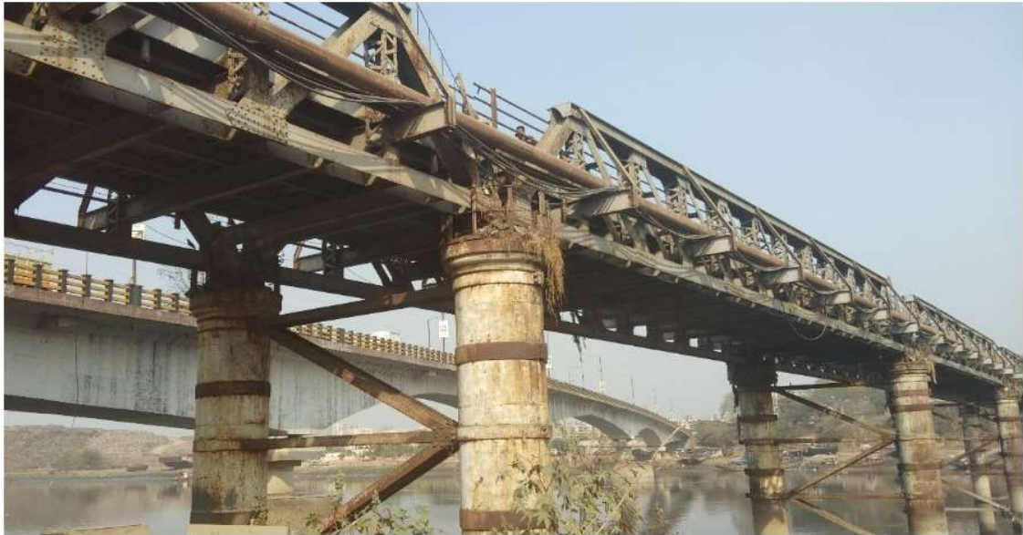
Figura 3. Foto da ponte que mostra o tipo estrutura metálica.

e alargamento; retificação para fornecer acabamento ou tolerâncias necessárias em superfícies de aço; fazer pequenos reparos nos conveses da área de trabalho; montagem de elementos reparados ou substituídos e itens incidentais por soldagem ou parafusos de alta resistência à tração; e preparar superfícies danificadas ou deixadas nuas pelo trabalho e aplicar uma camada de tinta de primeira qualidade.