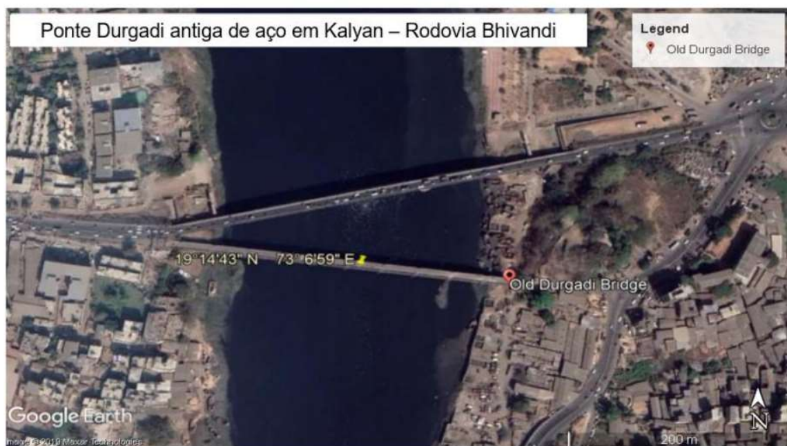
Figura 1. Google maps da ponte.

Devido à forte poluição no rio Ulhas, à água e à umidade devido à proximidade da beira-mar, a condição da ponte está muito deteriorada. Há forte corrosão nos elementos de aço usados na estrutura. A estrutura deve ter sido projetada para a água do rio normal em 1914. No entanto, é visto que a cor da água do rio é escura, o que pode ser devido à mistura de águas residuais das áreas urbanas circundantes e de resíduos industriais. A água do rio contém produtos químicos orgânicos e inorgânicos, além de vários gases como H 2 S, CO 2 , CH 4 e NH 3 etc., formados devido à decomposição do esgoto. Isso leva a uma deterioração mais rápida da estrutura de aço e concreto.