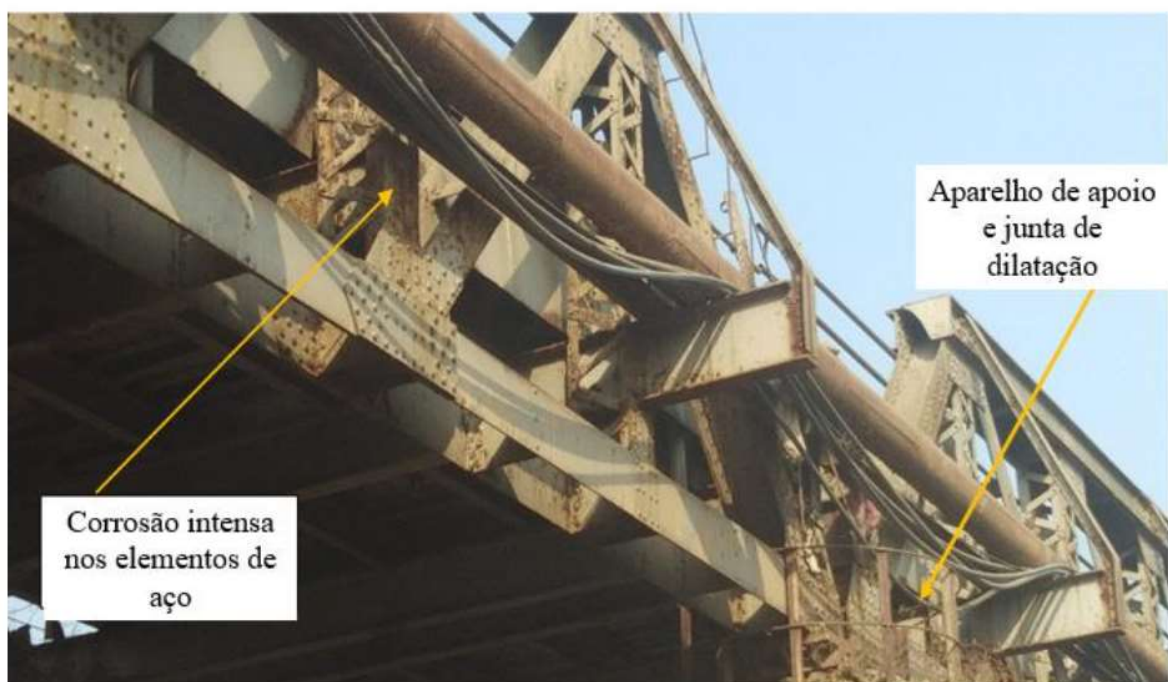
Figura 2. Foto da ponte que mostra o local do aparelho de apoio e junta de dilatação

Esta avaliação inclui mapeamento de perda de capacidade resistente. Tipos especiais de câmeras e mergulhadores certificados serão necessários devido ao fato da água ser turva devido à poluição. Isso envolverá videografia subaquática e tirar fotografias e detalhes da pesquisa de envio em cópias eletrônicas e relatório de status da pesquisa subaquática. O número total de pilares a serem pesquisados será de 9 pilares da ponte.