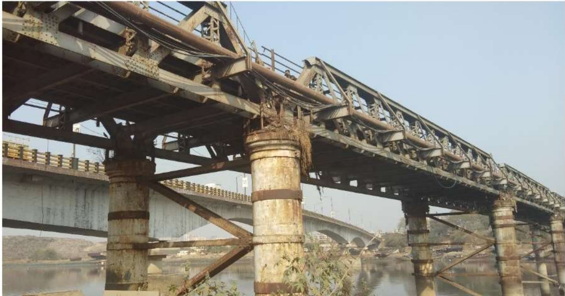
Figura 3. Foto del puente que muestra la estructura tipo Warren Truss.

de elementos reparados o reemplazados y elementos incidentales mediante soldadura o atornillado de alta resistencia a la tracción; y preparando superficies dañadas o dejadas al descubierto por el trabajo y aplicando una capa de pintura.