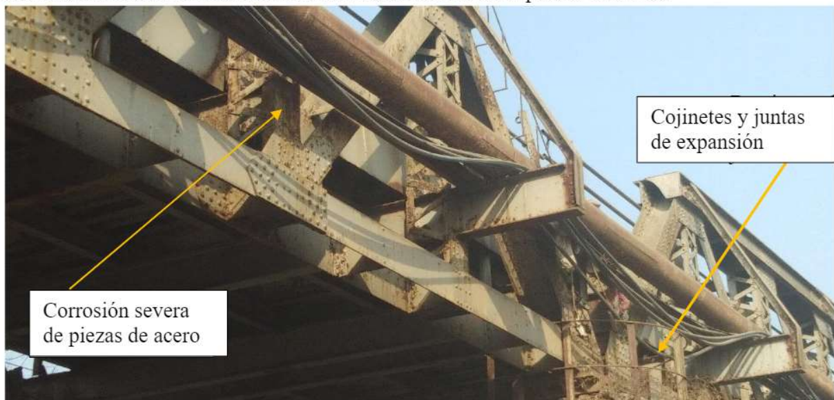
Figura 2. Foto del puente que muestra la ubicación de la junta de rodamiento y expansión

Mapeo de daños. Se necesitarán tipos especiales de cámaras y buzos certificados debido a la turbidez debida a la contaminación. Implicará la videografía subacuática y la toma de fotografías y detalles de la revisión, envío de éstas en copias digitales y un informe del estado de la revisión subacuática. El número total de muelles a ser revisados en el puente será de 9.