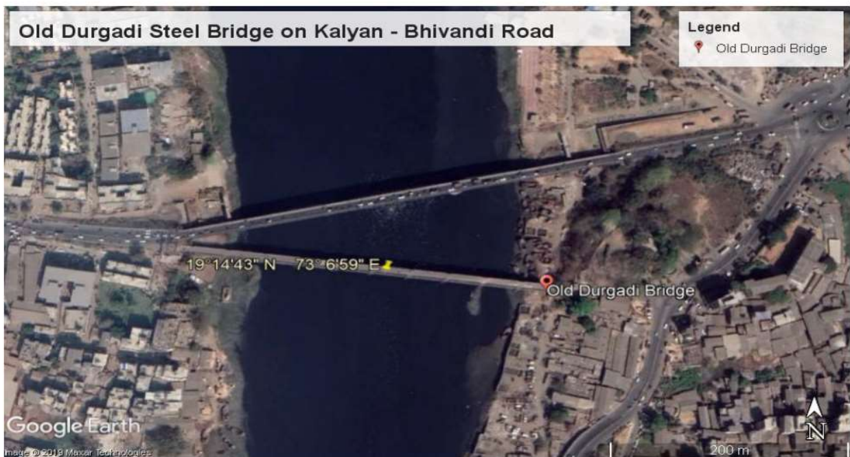
Figura 1. Mapa del Puente en Google.

Debido a la fuerte contaminación en el río Ulhas, al agua, la humedad y debido a la cercanía de la orilla del mar, el estado del puente está muy deteriorado. Hay una fuerte corrosión de las piezas de acero utilizadas en la estructura. La estructura debe haber sido diseñada para el agua normal del río en 1914. Sin embargo, se ve que el color del agua del río es negruzco, lo que puede deberse a la mezcla de las aguas residuales de las áreas urbanas circundantes y los desechos industriales. El agua del río contiene productos químicos orgánicos e inorgánicos además de varios gases como H 2 S, CO 2 , CH 4 y NH 3 , etc., que se forman debido a la descomposición de las aguas residuales. Esto conduce a un deterioro más rápido de la estructura de acero y el concreto.