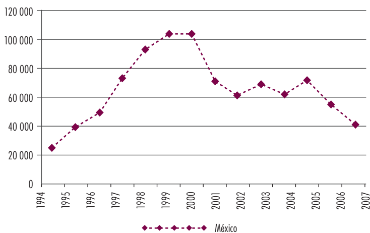
Gráfica 2 Estados Unidos: Importación de prendas de algodón de México (miles de dólares)