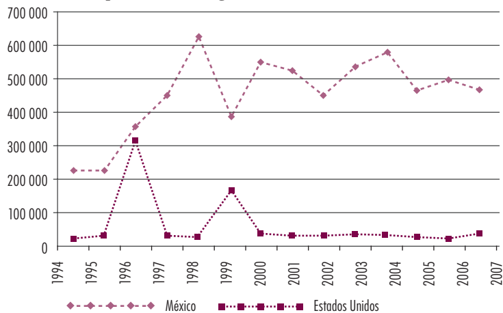
Gráfica 1 Importaciones de algodón 1994-2007 (miles de dólares)

Fuente: Badecel, CUCI Rev. 3, Grupo 263.