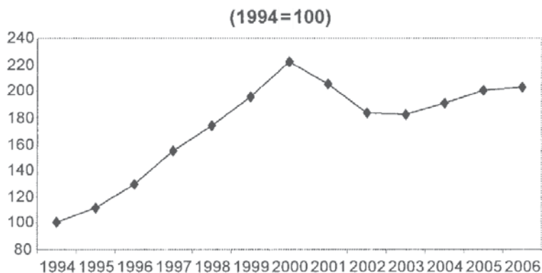
Gráfica 1. Empleo en la maquiladora, 1994-2006

Fuente: elaboración propia con datos del IMSS.