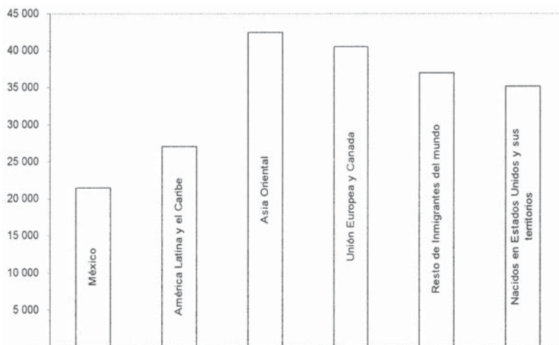
Gráfica 3. Estados Unidos: salario promedio anual por país y región de nacimiento, 2003 (dólares).

Más que remitirse a factores de oferta y demanda en el ámbito binacional, la transnacionalización laboral responde a factores estructurales que impulsan la migración masiva. Además de la segmentación y, en ciertos casos, precarización de los mercados laborales, acontece también una inserción diferenciada de la población inmigrante. Ello se relaciona con los circuitos migratorios y genera perspectivas diversas de integración, desde la asimilación que asciende —presente parcialmente en el circuito histórico— hasta modalidades descendentes, en el mayor de los casos, propias de un proceso de exclusión transnacional y vulnerabilidad para la segunda y tercera generaciones. Ese proceso se vincula con la tendencia dominante en el mercado laboral estadounidense, que influye en la reestructuración laboral de México, de reemplazo de trabajadores permanentes por temporales, al grado de convertirlos en lo que Levine (2001) califica como “trabajadores desechables”.