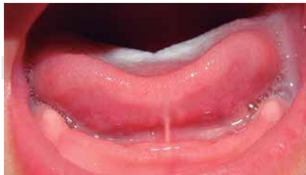
Figura 1. Aspecto clínico de anquiloglosia, donde se observa la limitación del movimiento lingual adoptando la forma de la letra V.

El diagnóstico de anquiloglosia es clínico. Algunos autores la han determinado anatómicamente cuando se observa la inserción del frenillo lingual cercana a la punta de la lengua, ocasionando que se observe en forma de la