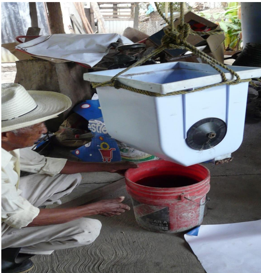
Figura 6. Tecnología casera realizada para percolar y obtener la lejía de ceniza. Figure 6. Homemade technology made to percolate and obtain ash lye.