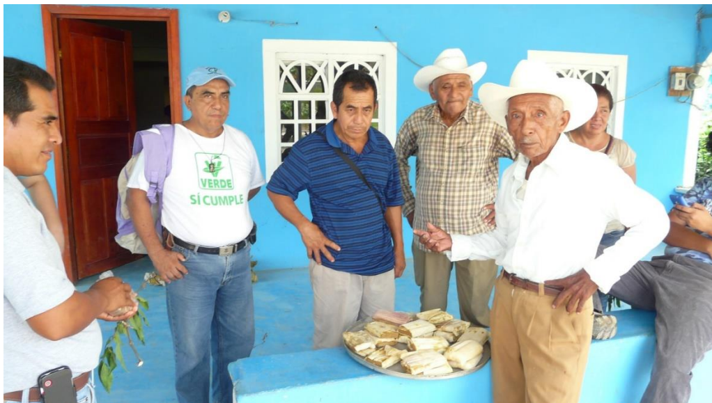
Figura 9. Algunos campesinos participantes en la elaboración artesanal de jabón de corozo del Poblado C-28, Cárdenas, Tabasco, México.

Figure 9. Some farmers participating in the artisanal production of corozo soap from Poblado C-28, Cárdenas, Tabasco, Mexico.