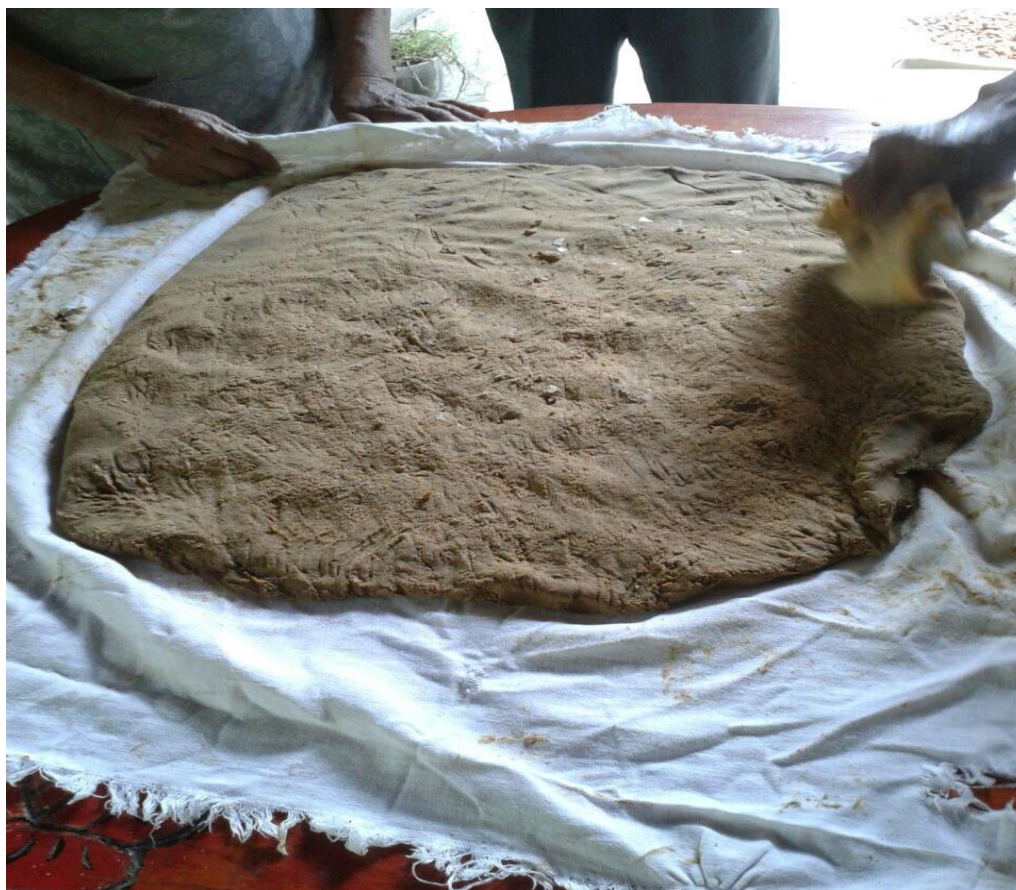
Figura 8. Pasta de jabón extendida sobre la tela.