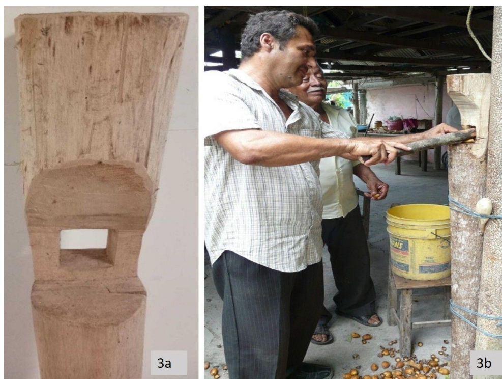
Figura 3a. Vista frontal del palo pela corozo. 3b. uso del palo pela corozo y complemento para eliminar la cáscara del fruto. Figure 3a. Front view of the palo pela corozo. 3b. use of the palo pela corozo and accessory for removing the fruit's peel.

dentro del orificio del primer elemento, para ejercer presión tipo palanca sobre el fruto y quitar la cáscara. El palo pela corozo se amarró a un poste del patio, usando olotes de maíz para mejor sujeción y evitar que se moviera durante su uso (Figura 3b).