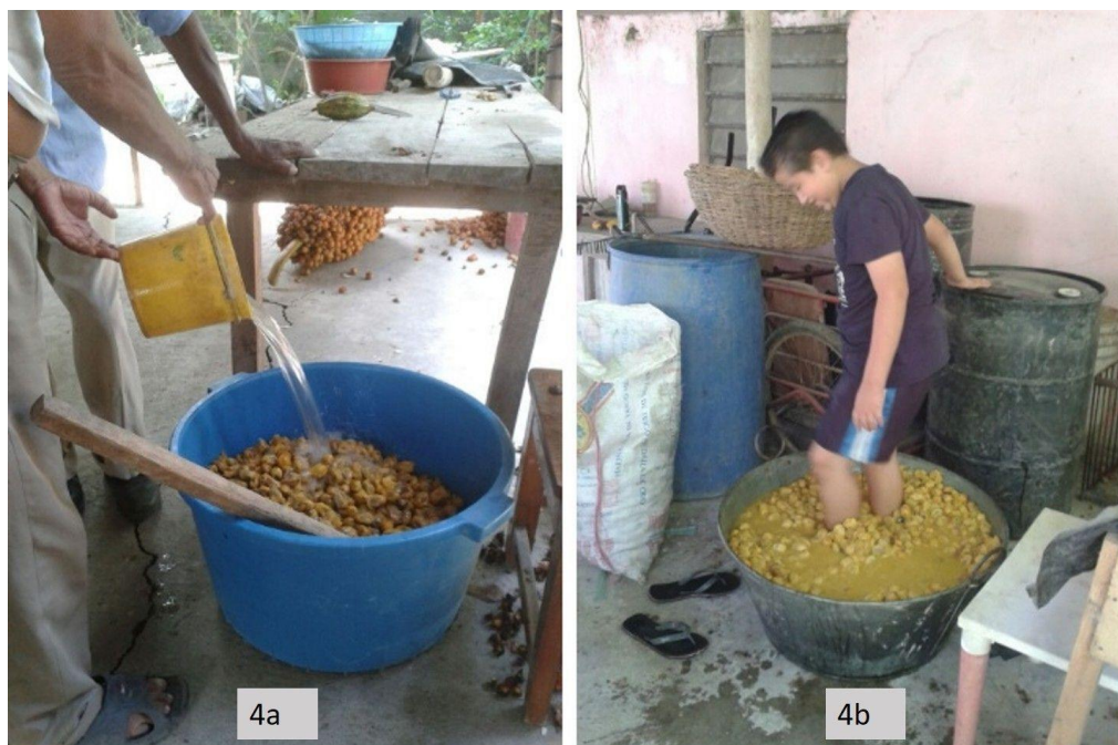
Figura 4a. Preparación del fruto de corozo en agua, removido con paleta de madera. 4b. Pisado del fruto de corozo en agua para separar la grasa.

El fruto sin cáscara se colocaba antiguamente en un cayuco (embarcación de madera). En el presente trabajo se usó un recipiente de plástico con capacidad de 60 litros en el cual se colocó 99.62 kilos de frutos y se agregó suficiente agua hasta 8 cm sobre el nivel de los frutos (Fig. 4a). Se removieron los frutos con una paleta de madera y se pisaron con los pies para separar la grasa del fruto (Fig. 4b). Se tapó el recipiente y se dejó reposar en un lugar sombreado y fresco por 72 horas.