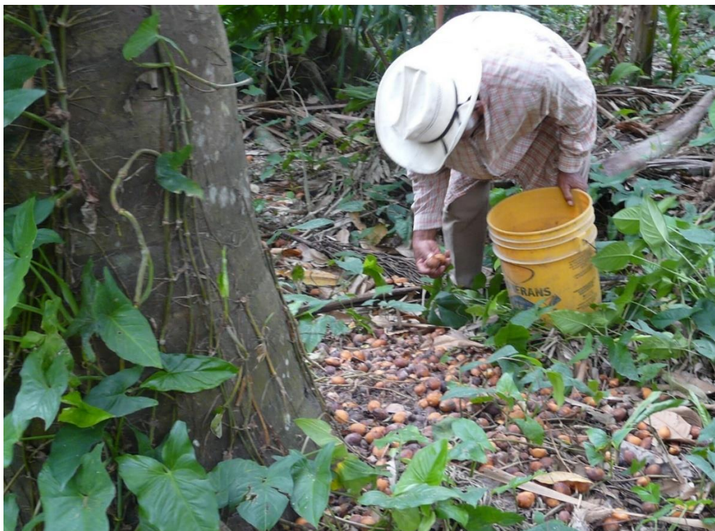
Figura 2. Recolección del fruto de Attalea butyracea .