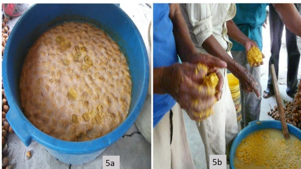
Figura 5a. Grasa de corozo después de 72 horas de remojo en agua. 5b. Separación de la grasa de corozo del agua. Figure 5a. Corozo fat after 72 hours of soaking in water. 5b. Separation of the corozo fat from the water.

Se aprietan los frutos con las manos para que queden bien lavaditos, restregando unos con otros. Se van sacando los frutos y también la manteca que flota sobre el agua pero separadamente. Cuando hace calor la manteca esta blandita, cuando hace frío, está dura como grasa de tractor, pero no se pega. Se echa en un traste y una vez sacado ya no tiene problema (Sr. Eraclio. Julio del 2015).