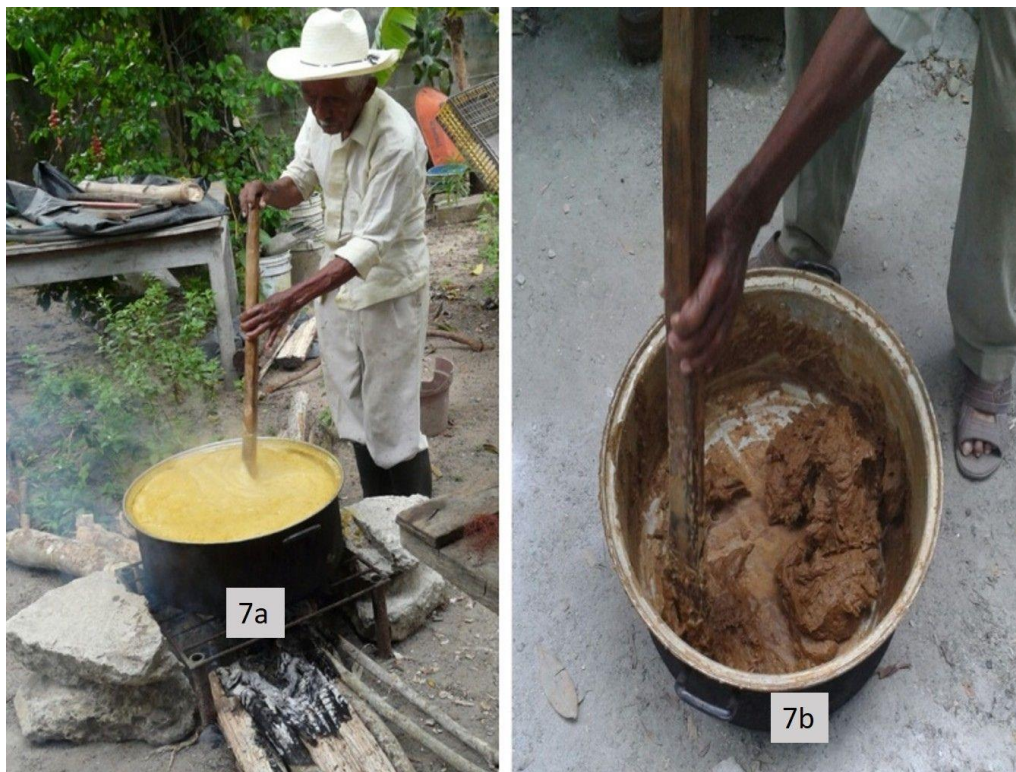
Figura 7a. Mezcla inicial. 7b. mezcla final del proceso artesanal de saponificación. Figure 7a. Initial mix. 7b. Final mixture of the artisanal saponification process.

derrame, pero aun así se le debe agregar más lejía. Cuando ya mermó se puede dar vuelta a la pelota de manteca con la paleta, significa que ya está seca, entonces se saca del fuego y del recipiente. Tiene que quedar sólida la mezcla, para que cuando enfrie se endurezca el jabón (Sr. Eraclio. Julio del 2015).