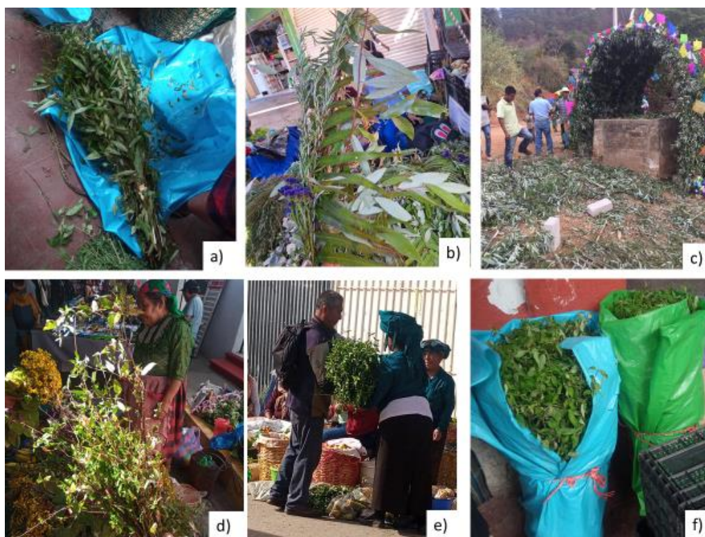
Figura 4. a) venta de L. glaucescens para uso alimenticio, b) presentación vendida para domingo de ramos y c) adorno de pozos en el día de la samaritana. d) rollos para uso medicinal con valor de $10.00., b) rollos de $100.00 y c) rollos de $400.00 para festividades.

A pesar del valor de uso que se calculó para cada mercado, estos no reflejan en ningún caso la cantidad de material vegetal que se utiliza para cada uno de ellos. Es muy importante mencionar que en ambas especies el uso para fines culturales-religiosos es el que demanda mayor cantidad de plantas. A pesar de que el valor de uso alimenticio es mayor que el cultural-religioso en L. glaucescens ; y que en C. macrostemum el valor medicinal es igual al valor cultural-religioso (Figura 4).