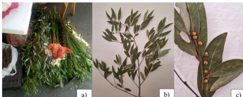
Figura 1. a) Litsea glaucescens Kunth comercializado en mercados tradicionales de Oaxaca. b) Individuo silvestre de L. glaucescens silvestre y c) Botones florales.

Litsea glaucescens Kunth es un arbusto con una sinonimia homotípica de Tetranthera glaucescens (Kunth) Spreng. De acuerdo con el listado de Plants of the World Online ( Litsea glaucescens Kunth), pertenece a la familia Lauraceae, tiene flores blancas dispuestas en racimos con corola pequeña y abundante; con un pistilo dividido en cuatro lóbulos estigmáticos; hojas alargadas de 6.96 cm de largo y 1.65 cm de ancho en promedio; color verde intenso en el haz 5GY en el haz (claridad 3, pureza 4), y el envés color verde claro 7.5GY (claridad 6, pureza 6), tallos de color marrón 10R (claridad 3, pureza 2) Munsell de colores vegetales (Figura 1).