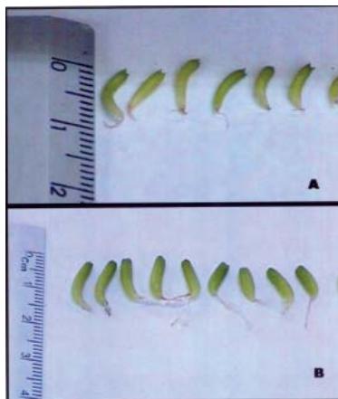
Fig. 3. Plántulas de Ferocactus de un mes de edad. A. Ferocactus histrix , plántulas provenientes del tratamiento con AIA 125 ppm. B. F. latispinus , plántulas provenientes del tratamiento control.

de plántulas en Ferocactus histrix , excepto para el diámetro de la raíz ( \square = 0.000411 , tratamiento AIA) y la variable peso de la plántula ( \square = 0.000548 , tratamiento AG_3 ) (cuadro 5). Un coeficiente de regresión positivo del efecto de RCV sobre crecimiento de las plántulas se obtuvo para los caracteres diámetro de la raíz y diámetro de la plántula con la aplicación de AIA y ANA; así como para diámetro de la plántula y peso de la plántula con la aplicación de tratamiento AG_3 en F. latispinus (cuadro 6).