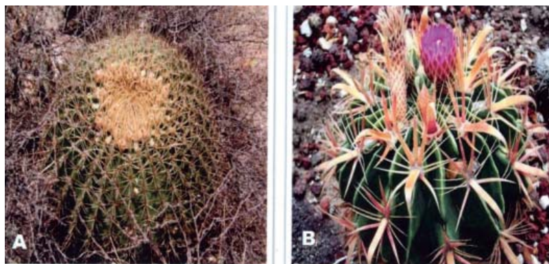
Fig. 1A. Ferocactus histrix (D.C.) Lindsay; B. F. latispinus (Haw.) Britton et Rose.

colocaron sobre cajas de Petri estériles con agar (Bioxon) y distintas concentraciones (125, 250 y 500 ppm) de AIA (3-indoleacetic acid Plant Cell Culture Tested Sigma-Aldrich), ANA (1-Naphthaleneacetic acid, Fluka Analytical) y AG 3 (Gibberellic acid, GA 3 , 90% Sigma-Aldrich). Se utilizó un diseño experimental completamente al azar con arreglo factorial de tratamientos (tres tipos de RCV) y tres repeticiones de 50 semillas cada una para cada dosis de RCV, así como un testigo o control (n = 50 semillas) para cada tratamiento, con la adición de agua destilada únicamente. El número de semillas germinadas se registró cada tercer día durante 30 días, hasta que terminó la germinación, utilizando como criterio de germinación positiva la emergencia de la radícula. Con los datos obtenidos se calculó el porcentaje de germinación (%G) y el índice de velocidad de germinación (IVG) donde IVG = \sum (ni/ti) , ni = número de semillas germinadas; ti tiempo en días para la germinación (Vadillo et al. , 2004; Tilki, 2008). Previo al análisis estadístico (ANDEVA), los porcentajes de germinación fueron transformados a Arcsen