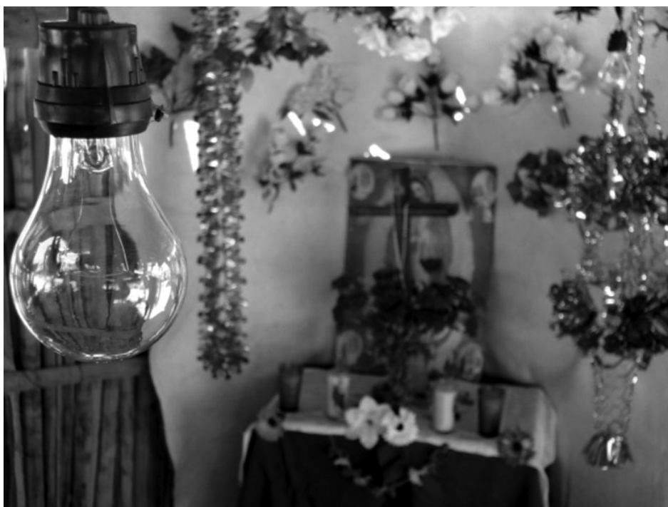
Altar, fiesta de La Santa Cruz El Pozo Prieto