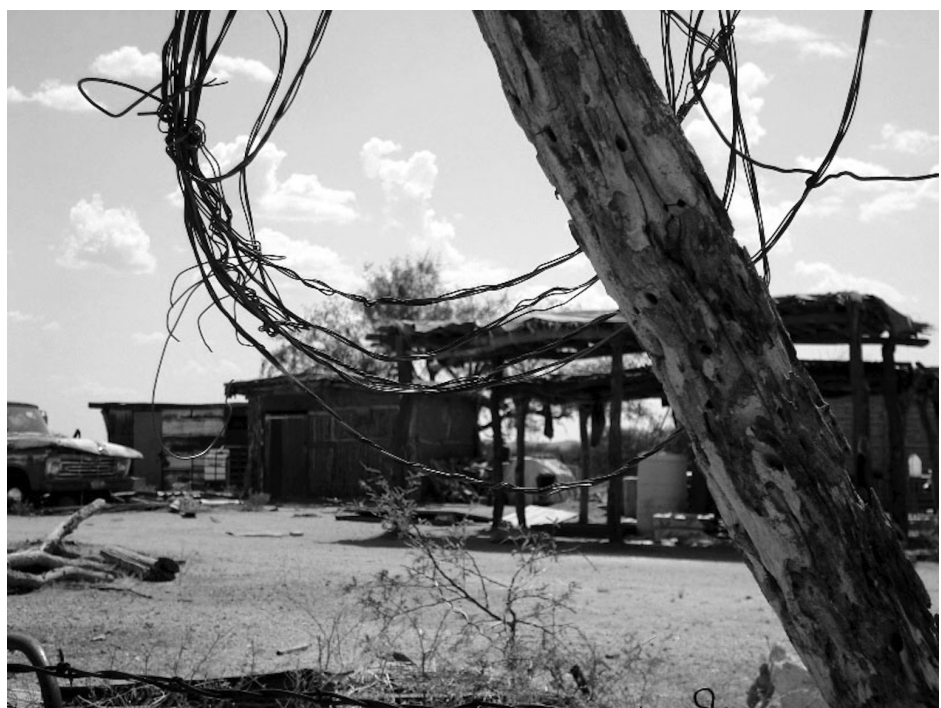
Casa en El Bajío