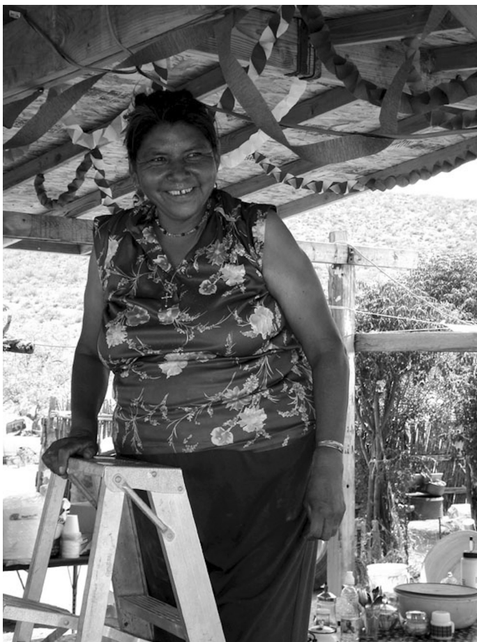
Ornamentos para la fiesta de San Juan El Cumarito