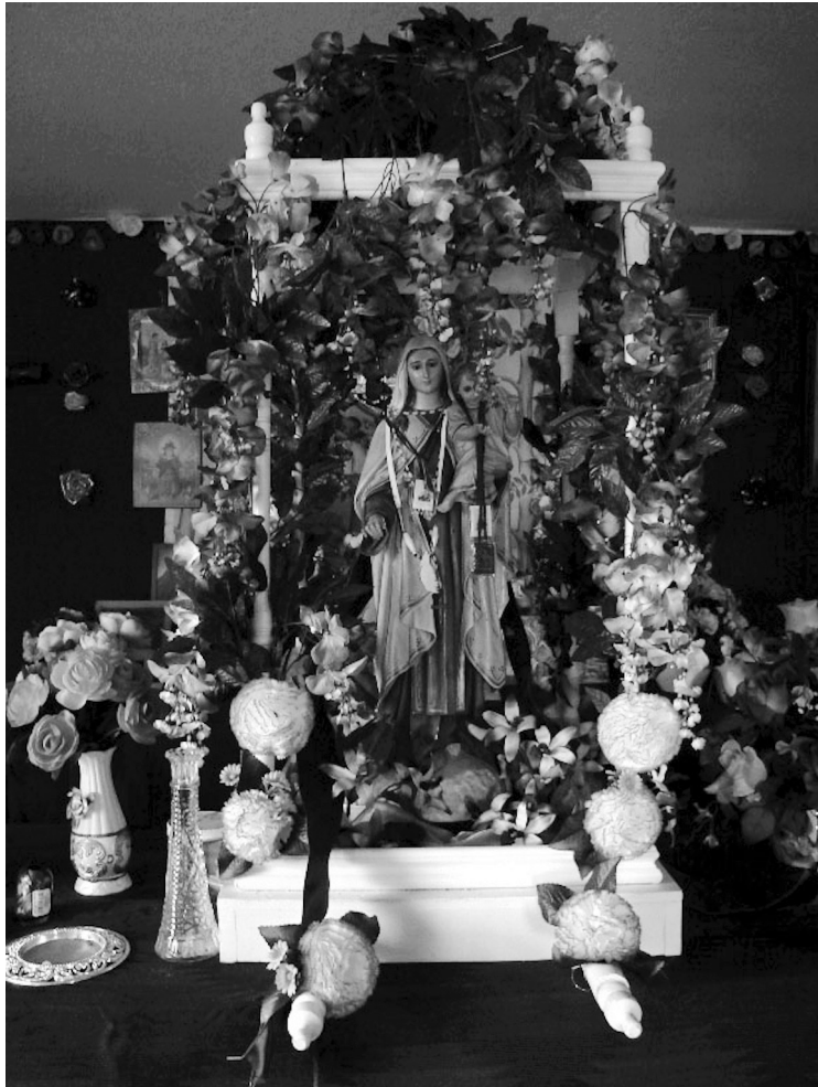
Virgen de la capilla de El Bajío