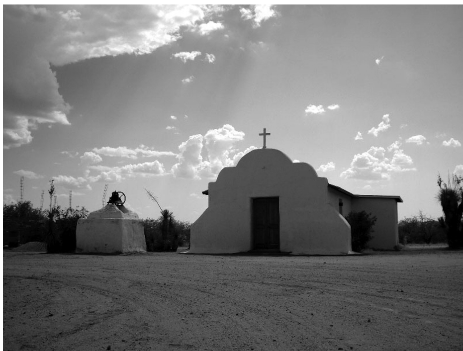
Capilla de El Bajío