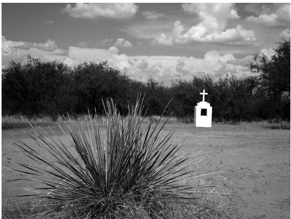
Inmediaciones de la capilla de El Bajío