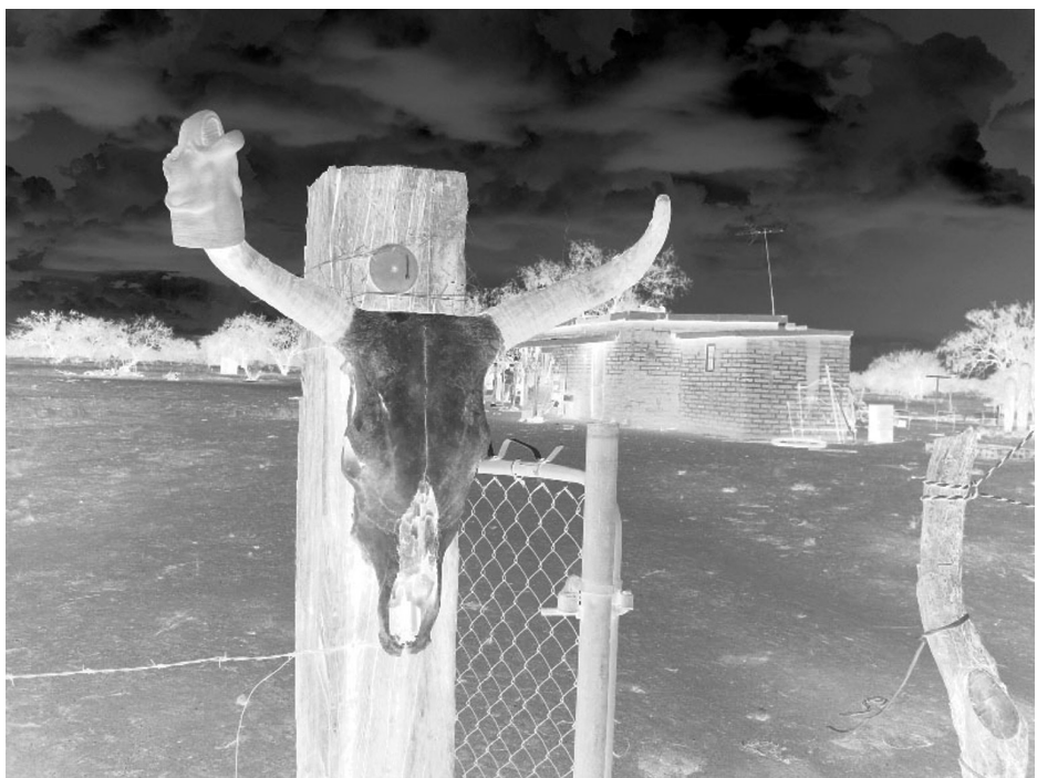
Puerta en El Bajío