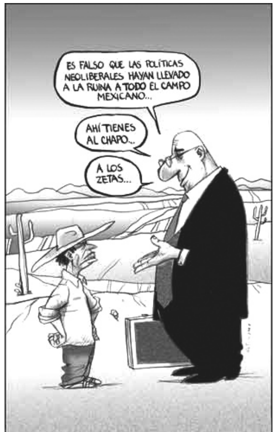
La Jornada, 03/06/08.