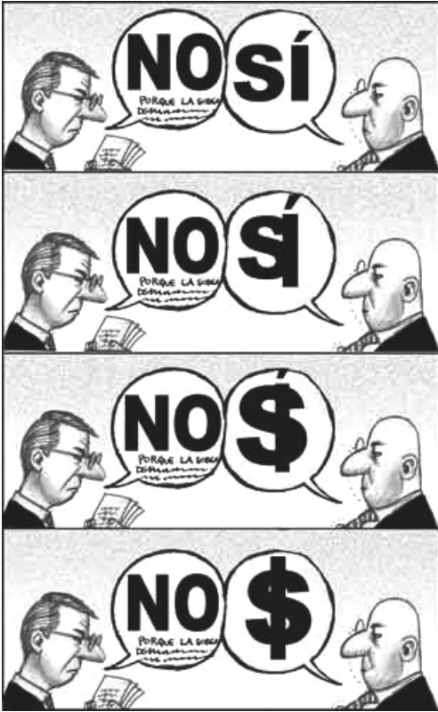
La Jornada, 15/05/08.