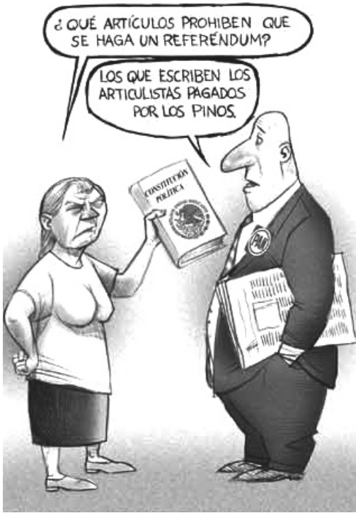
La Jornada, 06/06/08.