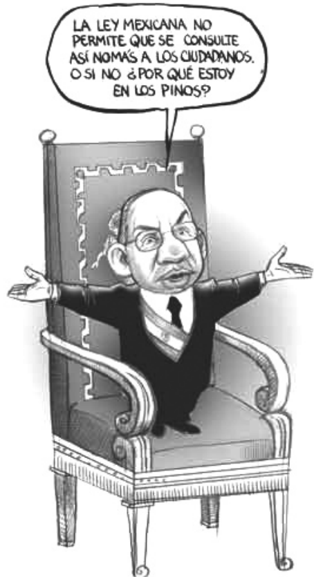
La Jornada, 05/06/08.