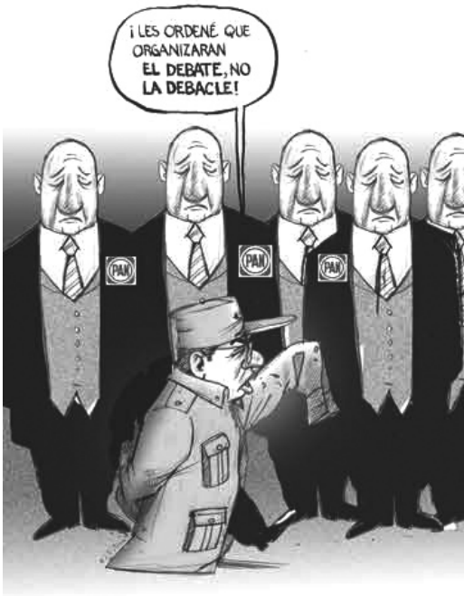
La Jornada, 12/06/08.