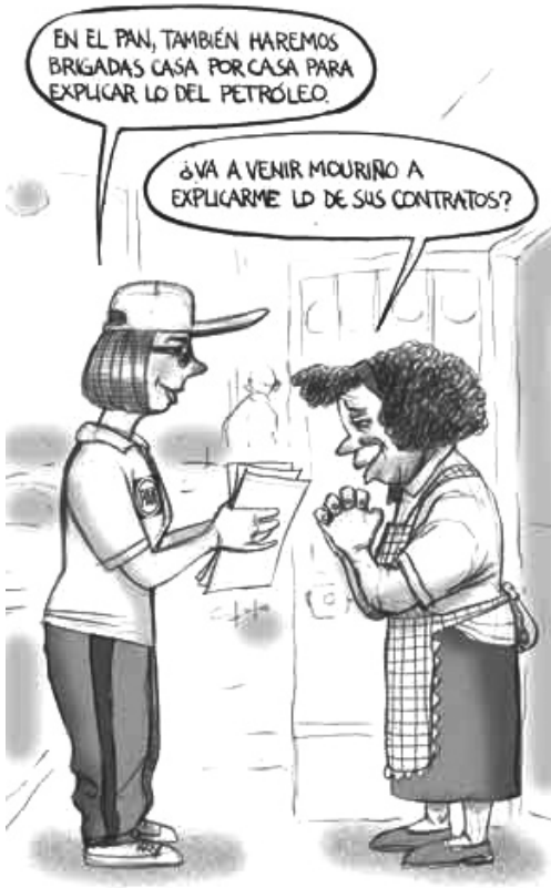
La Jornada , 24/06/08.