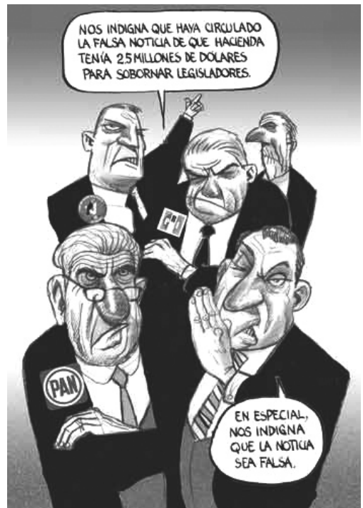
La Jornada , 20/06/08.