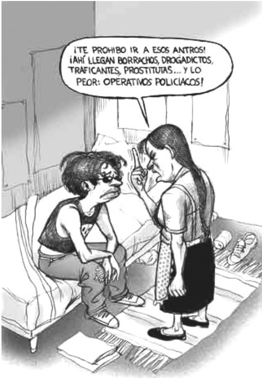
La Jornada, 27/06/08.