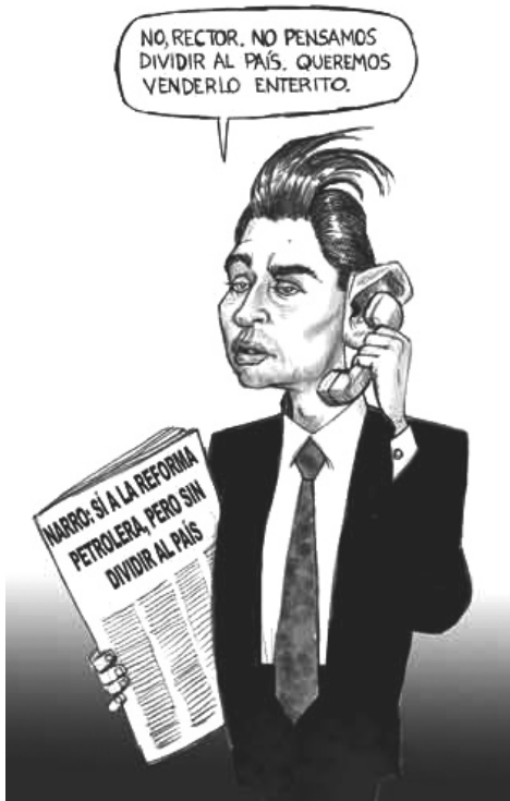
La Jornada, 25/06/08.