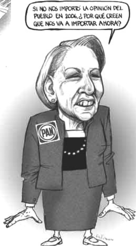
La Jornada, 28/06/08.