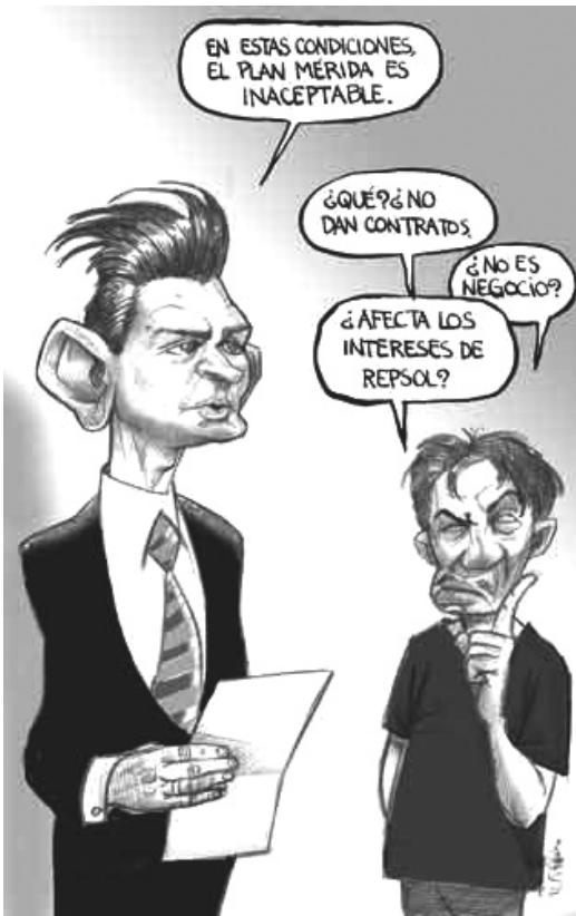
La Jornada, 04/06/08.