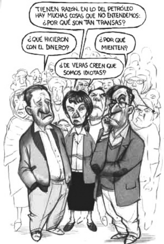
La Jornada, 11/06/08.