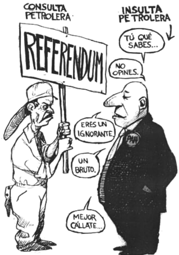
La Jornada, 18/06/08.