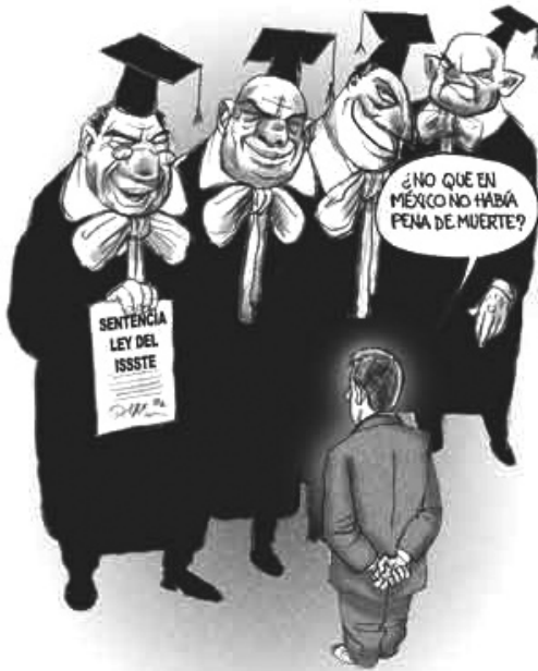
La Jornada, 19/06/08.