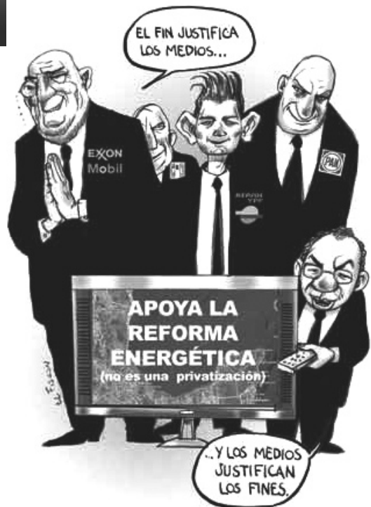
La Jornada, 26/06/08.